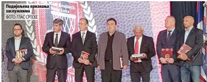
Подјелиена признања заслужницима

На свечаној академији уручена су бројна признања