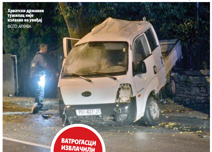
Хрватски државни тужилац није излазио на увиђај

Стравична несрећа десила се у суботу око 23.30 часова када је младић за воланом комбија "кија" прешао у лијеву траку за возила из супротног смјера. Ударио је у виши ивичњак, а потом предњим дијелом возила у стабло. Након удараца у стабло, возило се одбило и заротирало, те задњим дијелом ударило у зид ку-