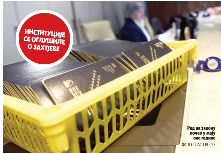
Рад на закону почео у мају ове године

Министарство цивилних послова БиХ је за циљ имало