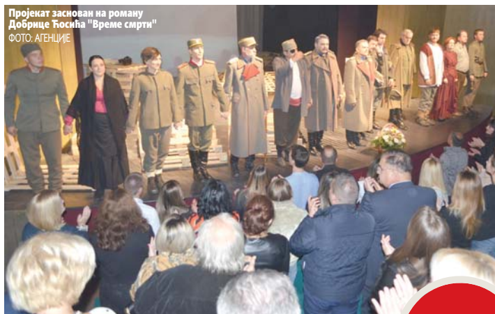
Пројекат заснован на роману Добрице Ћосића "Време смрти"

Отворена 66. позоришна сезона у Позоришту Приједор