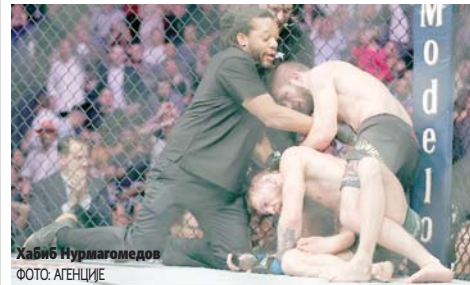
Хабиб Нурмагомедов

ЛАС ВЕГАС - Руски ММА борац Хабиб Нурмагомедов побиједио је Ирца Конора Мекгрегора и одбранио титулу