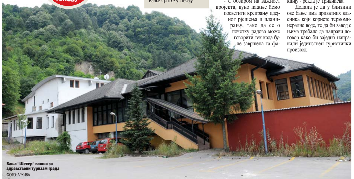
Бања "Шехер" важна за здравствени туризам града

ЈОШ НИЈЕ ПОЗНАТО КОЛИКО ЋЕ НОВИЦА БИТИ УЛОЖЕНО У ОБНОВУ