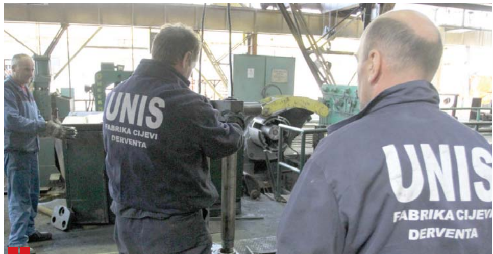
Радници "Униса" најавили генерални штрајк за четвртак