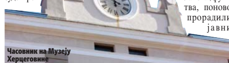
Часовник на Музеју Херцеговине

Он је подсетио да су својевремено, управо на залагање чланова друштва, поново прорадили јавни