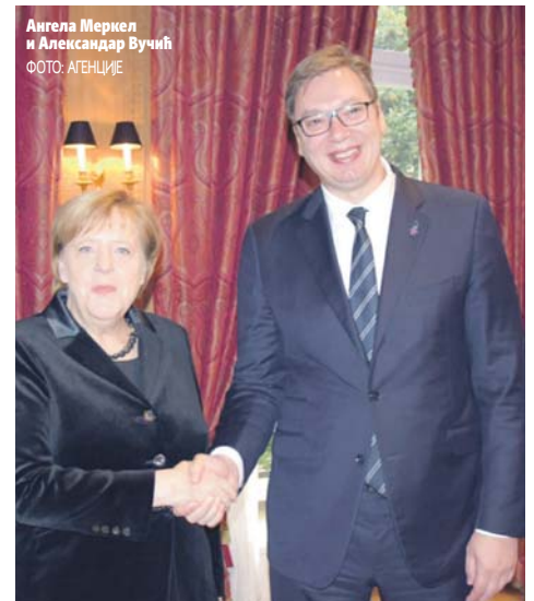
Ангела Меркел и Александар Вучић

- Напредњаци су стабилно изнад 50 процената. Минимално ослабе када се појави нека осетљива тема и само тада су ближе 50 него 53-54 процента - наводи Кљачар. (Агенције)