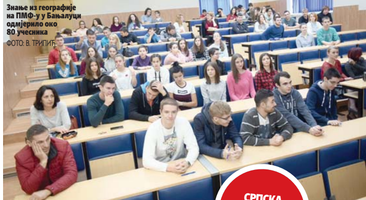
Знање из географије на ПМФ-у у Бањалуци одмјерило око 80 учесника.

Осим у Русији, гдје је први пут одржан 1. новембра 2015. године, на иницијативу предсједника Русије Владимира Путина, Географски диктат јуче је у исто вријеме организован у 63 земље, међу којима се налази и Република Српска. Знање у амфитеатру бањалучког ПМФ-а одмјерило је око 80 учесника, махом средњошколца и студената, а раме уз раме са њима тест су 45 минута испуњавали и њихови наставници и професори. Сигурни у своје знање и научне лекције, ђаци су са великим узбуђењем чекали да диктат почне. Ги-