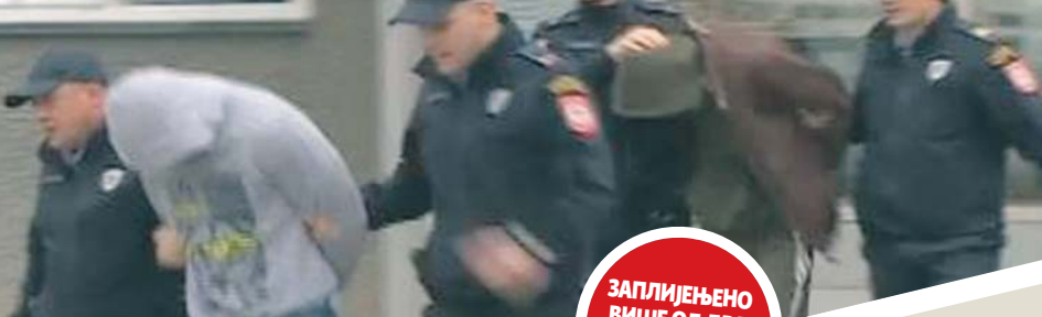
Привођење осумњичених

ЗАПЛИЋЕНО ВИШЕ ОД ДВА КИЛОГРАМА НАРКОТИКА