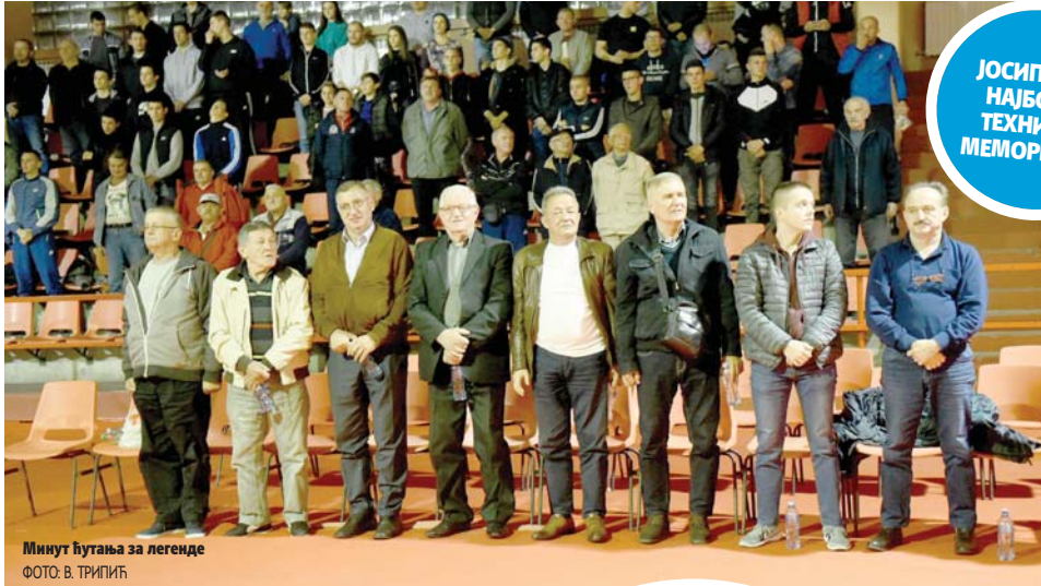
Минут ћутања за легенде

ЛОНДОН - Прва партија меча за првака свијета у шаху између актуелног шампиона, Норвешчанина Магнуса Карлсена, и изазивача, Американца Фабијана Каруана, завршена је ремијем последице седам часова надмудривања. Дуел је отворио холивудски глумац и љубитељ шаха Вуди Харелсон. Нови шампион свијета биће онај који први дође до 6,5 поена, а ако последице 12 предвиђених партија резултат буде изједначен, 28. новембра биће игран тај-брејк.