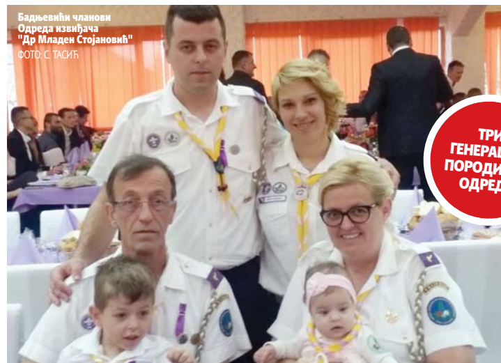
Бадњевић чланови Одред извиђача "Др Младен Стојановић"