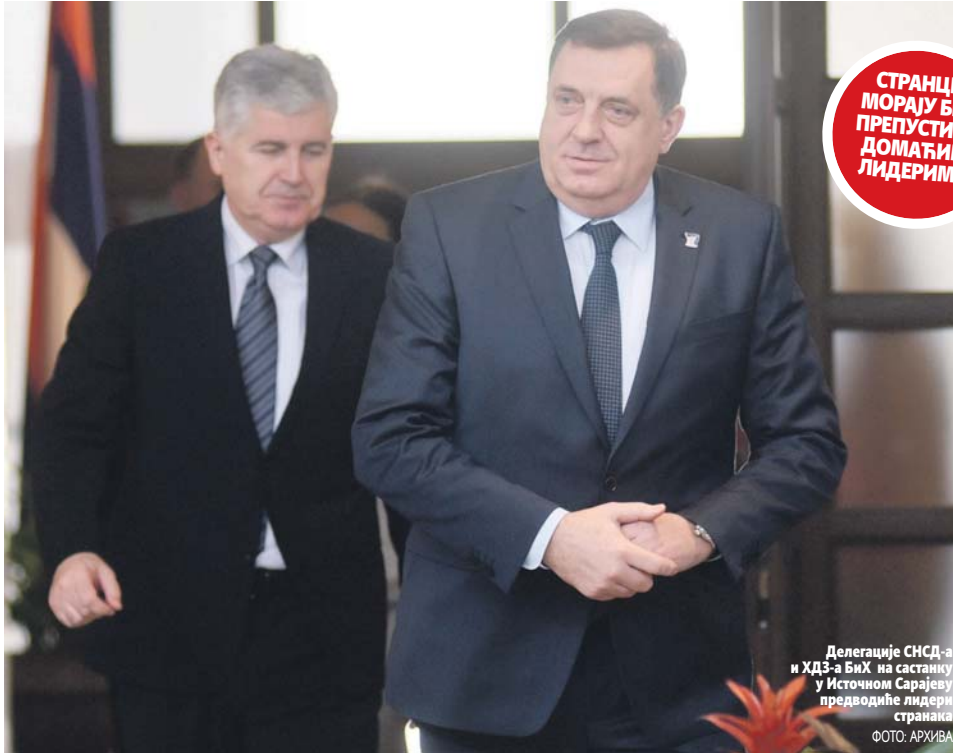
Делегације СНСД-а и ХДЗ-а БиХ на састанку у Источном Сарајеву предводиће лидери странака

- Чекамо, спортским рјечником речено, репрезентацију Бошњака на заједничком нивоу. Сада то изгледа веома конфузно и не желим да улазим у спекулације ко би то могао да буде. Они који буду имали квалификовану већину на нивоу