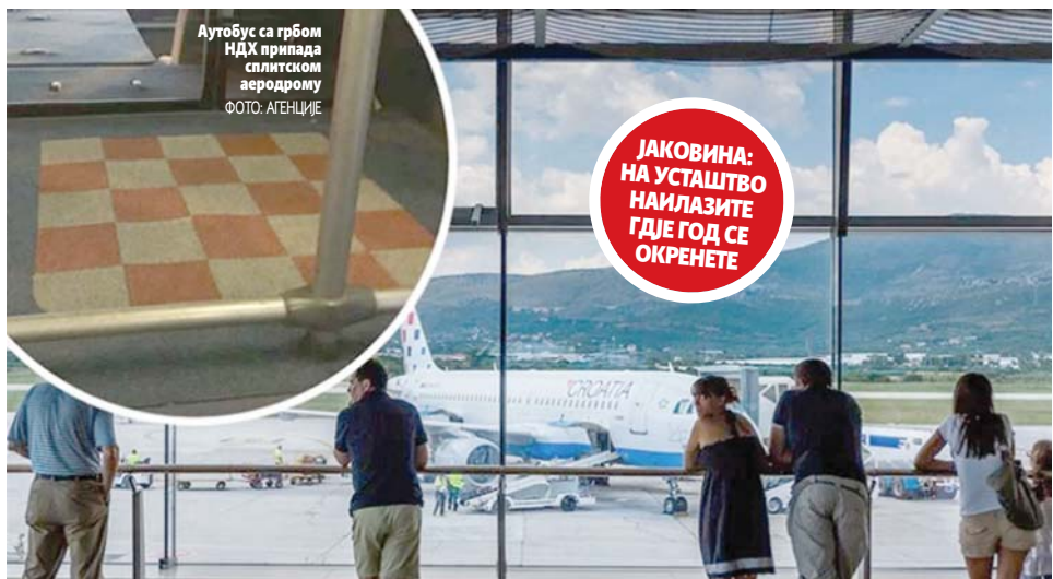
Аутобус са грбом НДХ припада сплитском аеродрому

ЈАКОВИНА: НА УСТАШТВО НАИЛАЗИТЕ ГДЈЕ ГОД СЕ ОКРЕНЕТЕ