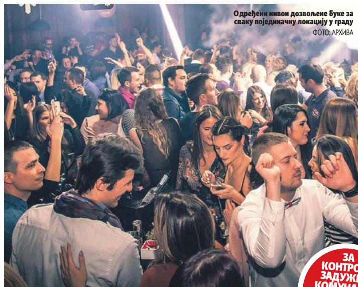
Одређени нивои дозвољене буке за сваку појединачну локацију у граду

дозвољене буке на Тргу Крајине биће 67 децибела, на Каселу, зависно од бине, 73 или 74 децибела, у парку "Младен Стојановић" 75 или 80, у простору "Акване" 70 децибела, те на Градском стадиону 67.