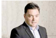
ШЕФИК ЦАФЕРОВИЋ ПОКАЗУЈЕ СНАГУ И МИШТЕЋЕ САМО КАД МИЛОРАД ДОДИК НИЈЕ У САРАЈЕВУ.

Вишковић ће после састанка са пензионерима разговарати са представницима Борачке организације РС, а након тога са представницима Републичке организације породица заробљених и погинулих бораца и несталих цивила. Мандатар ће консултације одржати и са представницима Савеза организација и удружења ратних војних инвалида РС, Удружења жена жртва рата, Савеза логораша, Савеза удружења цивилних жртва рата, Удружења ампутирача УДАС, те Удружења "Ветерани Републике Српске".