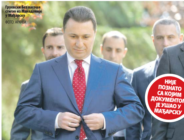
Груевски без пасоша стигао из Македоније у Мађарску