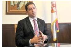
ВУК ЈЕРЕМИЋ СЕ НУДИ СТРАЊЦИМА ДА БУДЕ ЊИХОВА МАРИОНЕТА.

Заплијењена је комплетна документација, и то у склопу истраге коју је прије четири мјесеца покренуло Тужилаштво за организован криминал, а односи се на пословање ове фирме и на сумње да је Синиша Јаснић ненамјенски потрошио близу 200 милиона динара (1,6 милиона евра) грађана Србије. Другим ријечима, против њега је покренут нови поступак поред већ постојећег који га терети да је извршио кривично дјело провјере 13 милиона динара (110.000 евра) Универзитетског спортског савеза Србије, због чега је од 2. октобра у притвору. (Агенције)