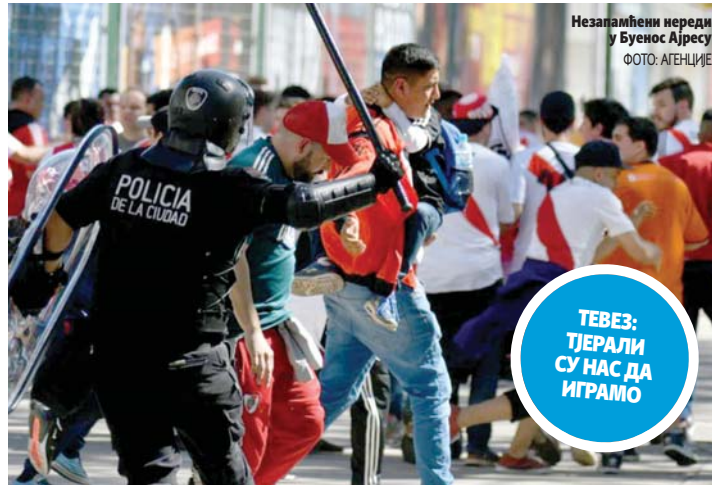
Незапамћени нереди у Буенос Ајресу

Популарни "суперкласико" требало је да одлучи ко ће постати шампион највећег такмичења у Јужној Америци, али због "рата" који се водио на улицама Буенос Ајреса меч на "Монументалу" никако није могао да буде одигран, па је помјерен за касно синоћ. У суботу су домаћи навијачи каменовали аутобус Боке и повриједили неколико фудбалера, што је изазвало инциденте са полицијом и натјерало госте да затраже помјерање утакмице. Међутим, медијска права и огроман новац који сама утакмица носи били су главна