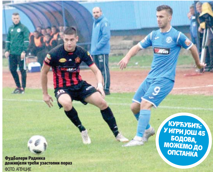
Фудбалери Радника доживјели трећи узастопни пораз