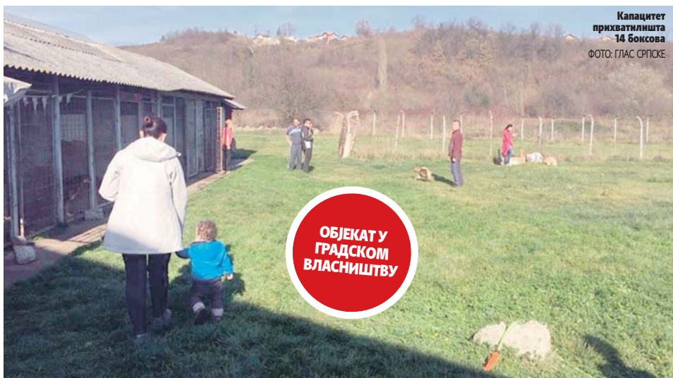
Капацитет прихватилишта 14 боксова