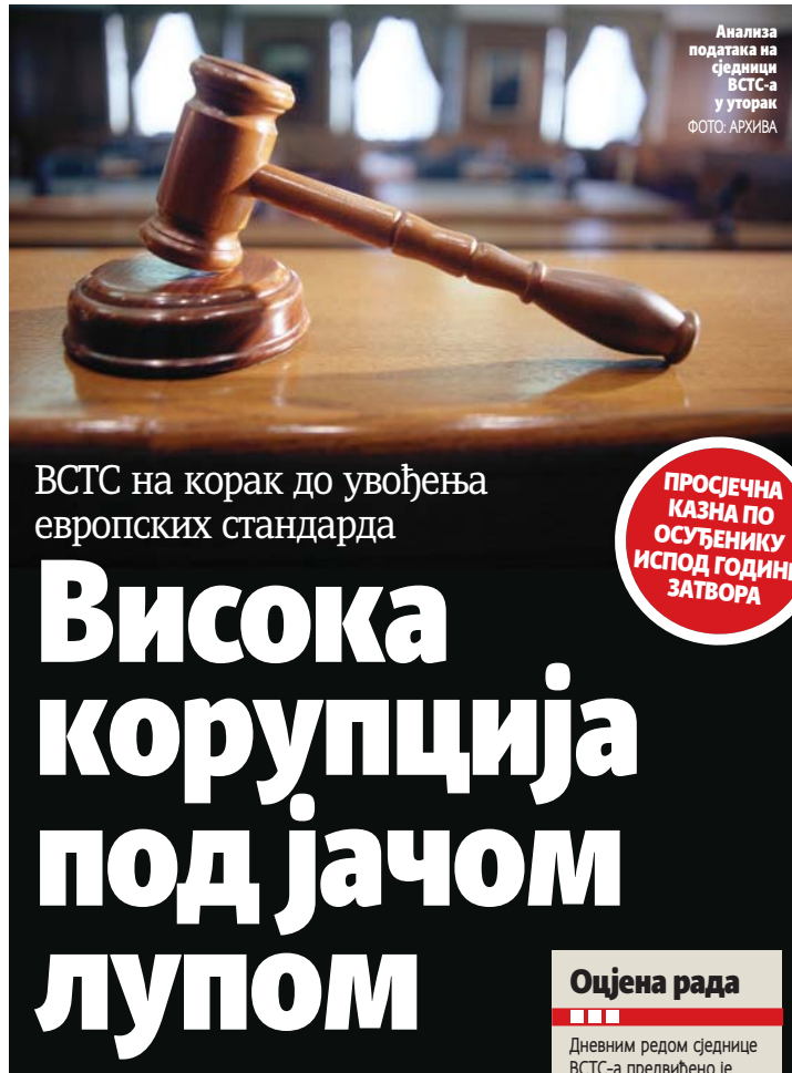
Анализа података на сједници ВСТС-а у уторак

Крајње је вријеме да Европа отвори очи, повуче праведан потез и омогући безбједно дјетињство и српској дјеци која одрастају на Косову пољу, тамо гдје су вијековима живјели њихови очеви, дједови и прадједови. Јер Косово је одувијек српско било и биће све док цвјета и посљедњи црвени бојур, ко год себи дао за право да прекраја границе.