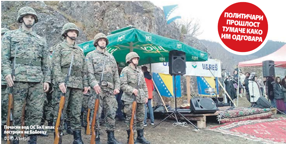
Почасни вод ОС БиХ ипак постројен на Бобовцу

ПОЛИТИЧАРИ ПРОШЛО ТУМАЧЕ КАКО ИМ ОДГОВАРА