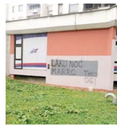
Фит исписан на зиду после постизборних потреса унутар ДНС-а. На првом графиту