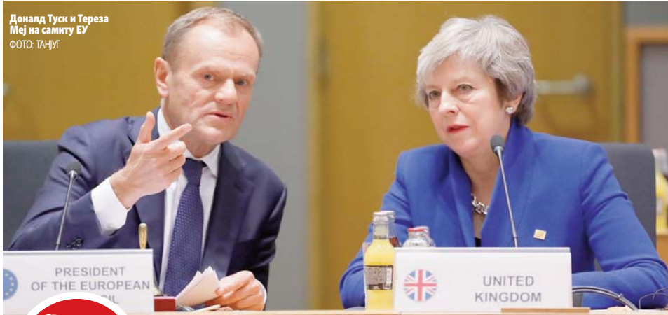
Доналд Туск и Тереза Меј на самиту ЕУ

СПОРАЗУМ ТРЕБА ДА ОДОБРИ БРИТАНСКИ ПАРЛАМЕНТ