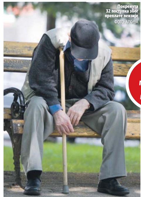
Покренута 32 поступка због преplate пензије

Несавјесни рођаци преминулих пензионера годинама стварају проблеме Фонду