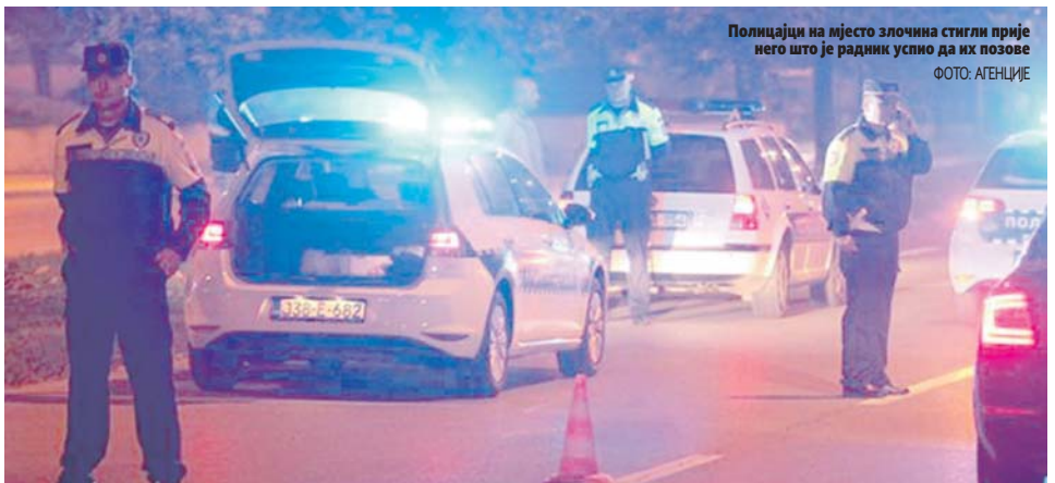
Полицијаци на мјесто злочина стигли прије него што је радник успио да их позове