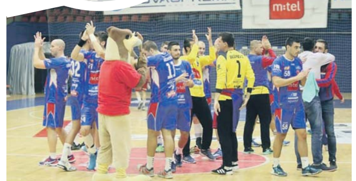
Бањалучани "презимили" у Европи послје 14 година

Остали могући ривали су Дикен (Финска), Повашка Бистрица (Словачка), Машека (Бјелорусија), Дуќла (Чешка), Визе (Белгија), Мадеира (Португалија) и Донбас (Украјина). Синоћ су играна још три реванш меча трећег кола, а много веће шансе за пролаз од ривала због предности из првих мечева имали су Берхем (Луксембург), Свијеса Вилњус (Литванија) и Арендал (Норвешка).