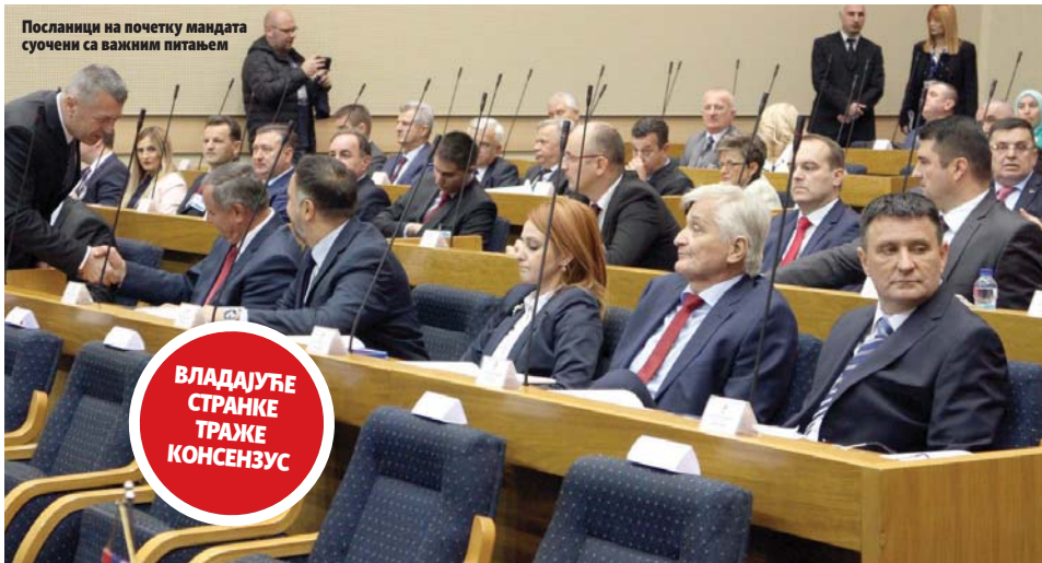
Посланици на почетку мандата суочени са важним питањем

- Бавили смо се и тиме на који начин да функционисе пуном снагом координација између наших људи у институцијама Српске и оних који обављају важне послове на нивоу заједничких органа у Сарајеву - рекла је Цвијановићева. (Срна)