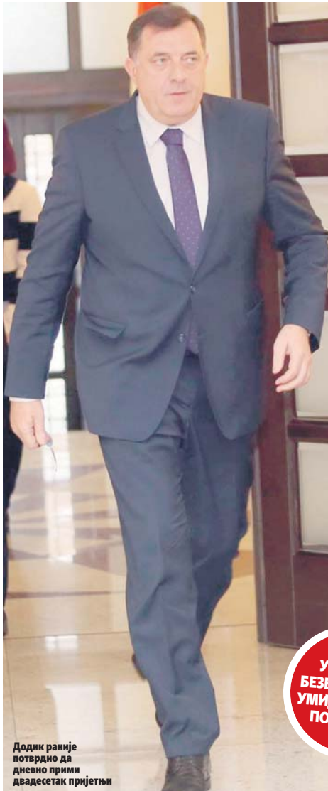
Додик раније потврдио да дневно прили двадесетак пријетњи

Иако су из МУП-а РС неколико пута изнијели аргументоване тврдње да дуго-