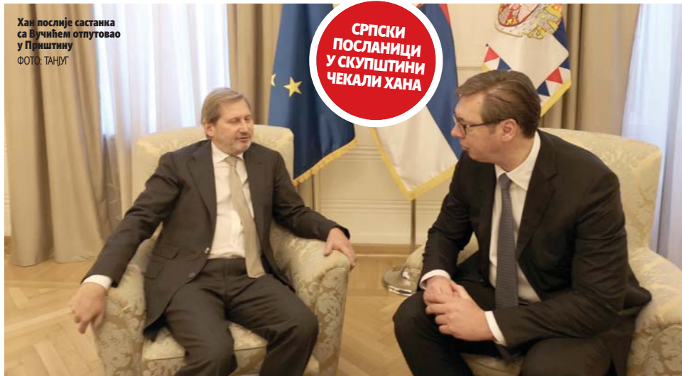
Хан послје састанка са Вучићем отпутовао у Приштину

Изјава коју је Хоџај послје демантовао изазвала бурну у региону