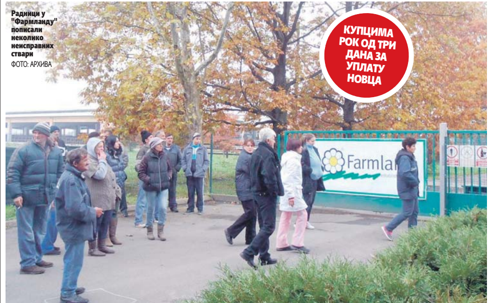
Радници у "Фармланду" пописали неколико неисправних ствари