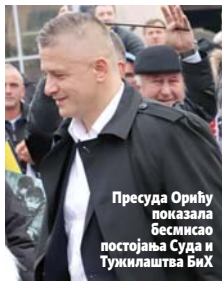
Пресуда Орићу показала бесмисао постојања Суда и Тужилаштва БиХ

Доћи ће и то питање на дневни ред. Сачекајте експозе, па ћете чути, каже мандатар Вишковић. То питање треба да буде покренуто, поручује Јунић. Опозиција чека одлуку владајућих странака