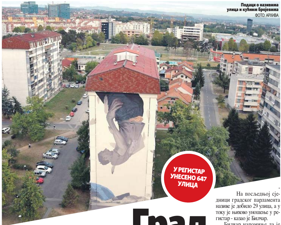
Подаци о називима улица и кућним бројевима