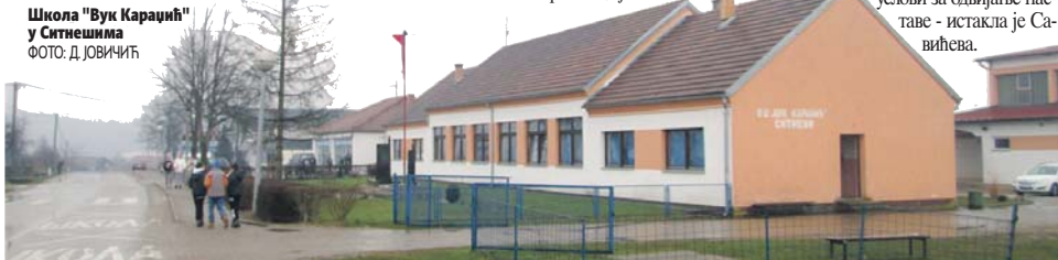
Школа "Вук Караџић" у Ситнешима

- Доласком хладнијих дана осјети се колико је ова помоћ била значајна јер кров више не прокишњава, а замијењене су опасне салонит плоче које су угрожавале здравље дјеце и учитеља. Просторије су такође много топлије због квалитетне изолације, тако да су у тој школи створени одлични услови за одвијање наставе - истакла је Савићева.