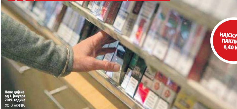
Нове цијене од 1. јануара 2019. године