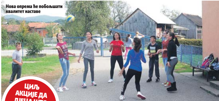
Нова опрема ће побољшати квалитет наставе

ЦИЉ АКЦИЈЕ ДА ДЕЦА ШТО МАЊЕ ВРЕМЕНА ПРОВУДУ НА УЛИЦИ