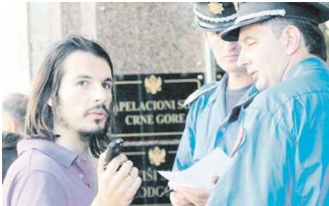
Будва не може да наплати дуг