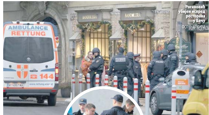
Рогановић убијен испред ресторана у Бечу

ЛИСТИНЗИ ПОКАЗАЛИ ДА ЈЕ ОСУМЊИЧЕНИ ЛАГАО ТОКОМ САСЛУШАЊА