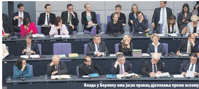
Влада у Берлину има јасан правац дјеловања према исламу

Путин је тестирање, које је било на далеком истоку Русије, посматрао из зграде Министарства одбране у Москви. (Агенције)