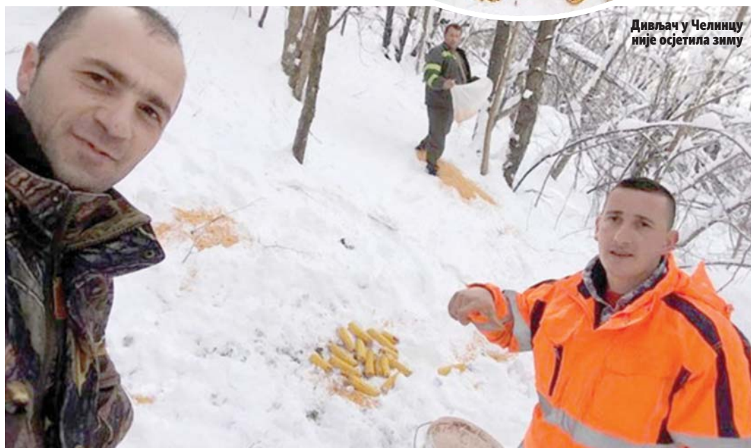
Дивљач у Челинцу није осјетила зиму