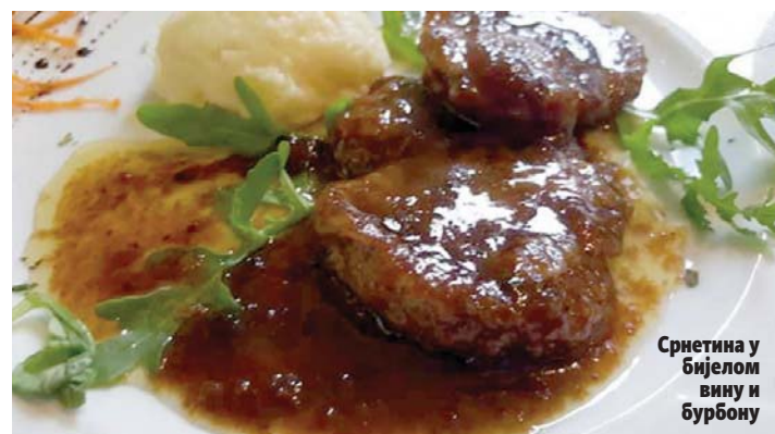
Срнетина у бијелом вину и бурбону