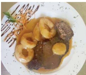
Стек од медвједа у умаку од крушка