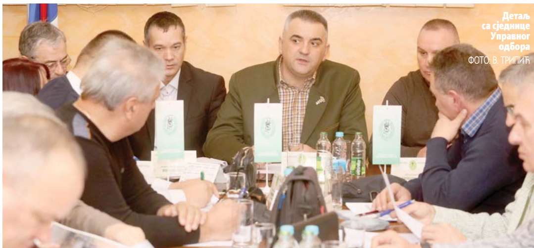
Детаљ са сједице Управног одбора

Управни одбор Ловачког савеза РС донио одлуку