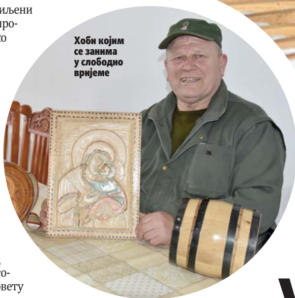
Хоби којим се занима у слободно вријеме