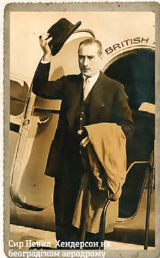
Сир Невил Хендерсон на београдском аеродрому

Овај британски племић и елитни дипломата Форин офиса последије мисије на нашем двору, од 1930. до 1936. и краћег боравка у Аргентини, постављен је 1937. на врућу столицу амбасадора у Берлину, одакле су се већ чули потмули ратни добоши. Историја га памти као човјека који је министру иностраних послова Рајха, Рибентропу, 3. септембра 1939, тачно у 9 часова, уручио ноту – ултиматум британске круне, у вези са агресијом на Пољску, која је фактички била објава рата Њемачкој. Тако је