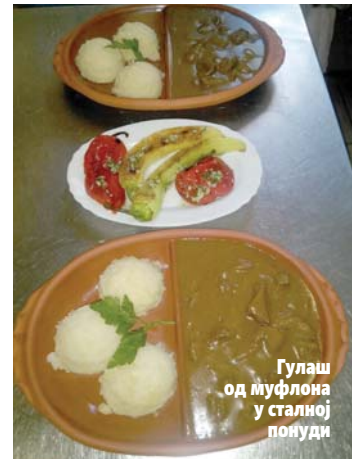
Гулаш од муфлона у сталној понуди

- Међу специјалитетима се издваја медвјед чије је месо посебног и изгледа и укуса. С времена на вријеме на менију се нађе и муфлон, а осим тога у понуди имамо и месо дивље свиње, срнеће дивљачи, патке и зечева - рекао је Плетикоса и додао да на менију имају и паштету, домаћи хљеб и