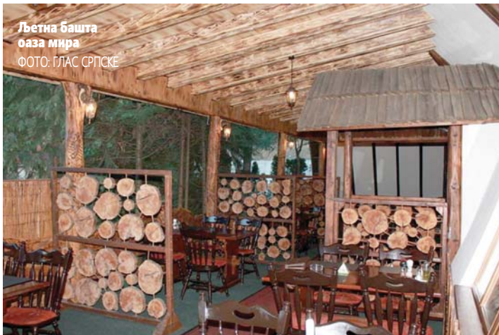
Љетна башта оаза мира

Међу специјалитетима се издваја медвјед чије је месо посебног и изгледа и укуса. С времена на вријеме на менију се нађе и муфлон, а осим тога у понуди имамо и месо дивље свиње, срнеће дивљачи, патке и зечева, рекао Плетикоса