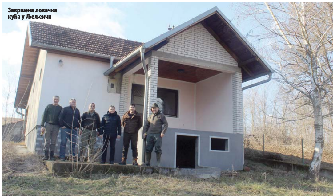
Завршена ловачка кућа у Љељенчи

- Озбиљно смо схватили припреме које трају већ неколико мјесеци. Није мала ствар дочекати овакав јубилеј па смо предузели све мјере да се сви наши гости у "Гранд салону" осјећају одлично. Једна компанија нам прави и филм који ће бити својеврсно путовање кроз историју - саопшти-