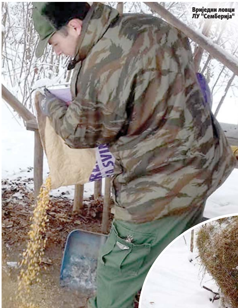
Вриједни ловци ЛУ "Семберија"

И на крају, као трећа мјера јесте обезбјеђење довољне количине квалитетне исхране за дивљач која ће јој бити доступна током зиме. Спровођење ове посљедње мјере, уз осигурање мира у ловишту, јесте једина могућа активност коју ловци могу да учине као помоћ дивљачи за вријеме дуготрајних високих сњегова, ниских температура и залеђеног земљишта, а по-