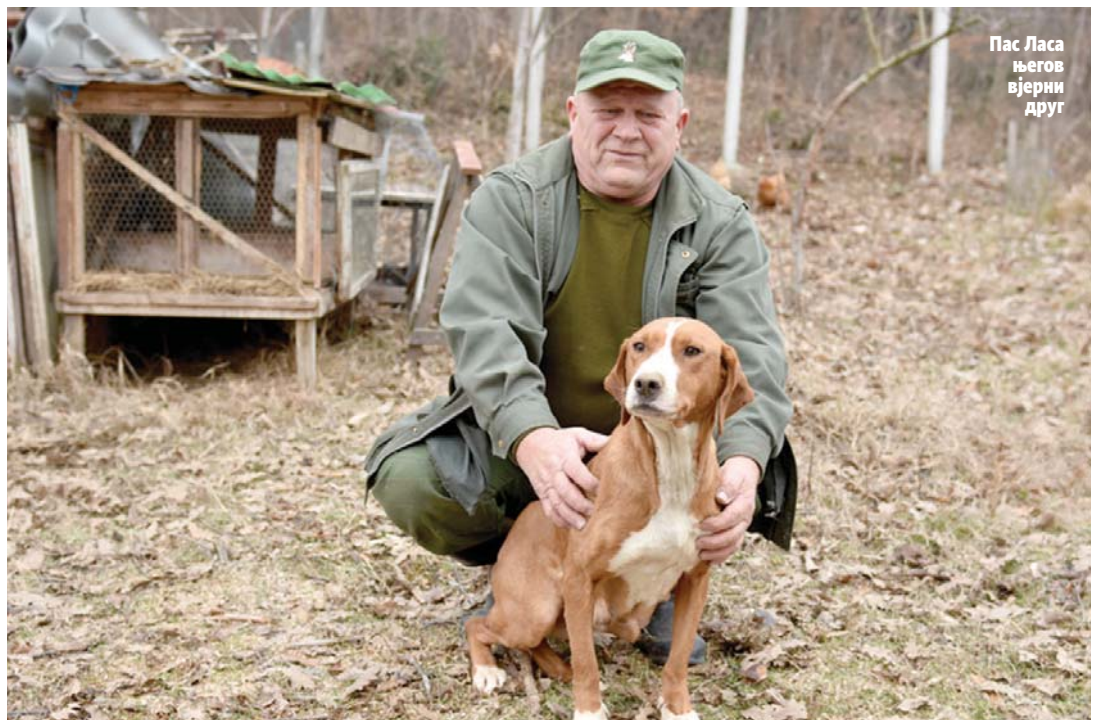
Пас Ласа његов вјерни друг