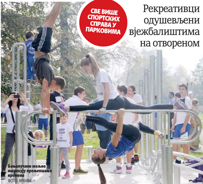
Бањалучани жељно ишчекују пролећна времена