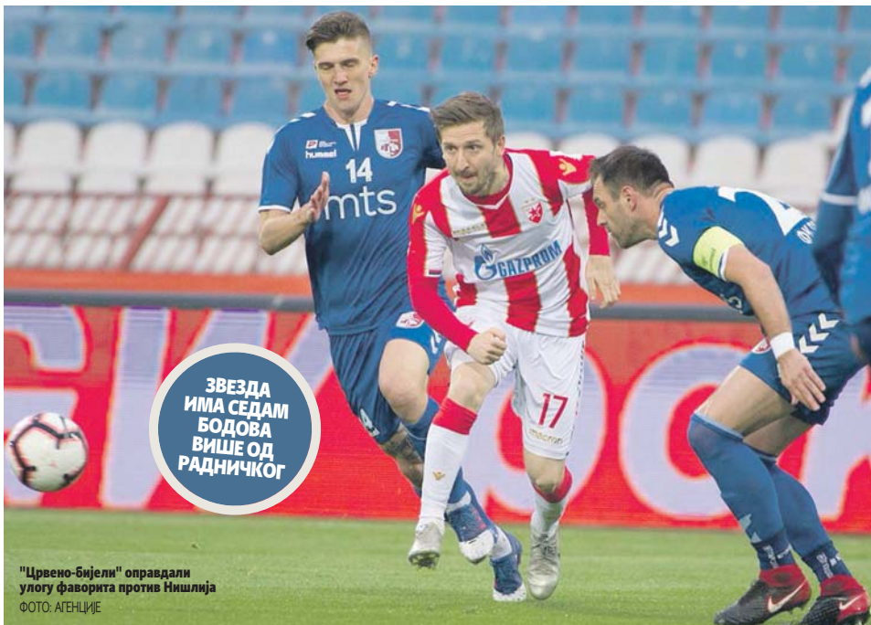
"Црвено-бијели" оправдали улогу фаворита против Нишлија

- Идемo даље, знамо да је Лала звездаш и зато нам