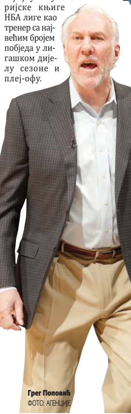
Грег Поповић

Кошаркаши Бруклина направили су брејк на гостовању Филаделфији Бобана Марјановића и побједом од 111:102 стекли 1:0 на старту плеј-офа Источне конференције. Марјановић је искористио шансу и за 15 минута дао 13 поена, уз четири асистенције и три скока. Остали резултати: Торонто - Орландо 101:104 (0-1), Голден Стејт - Лос Анђелес Клиперс 121:104 (1-0).