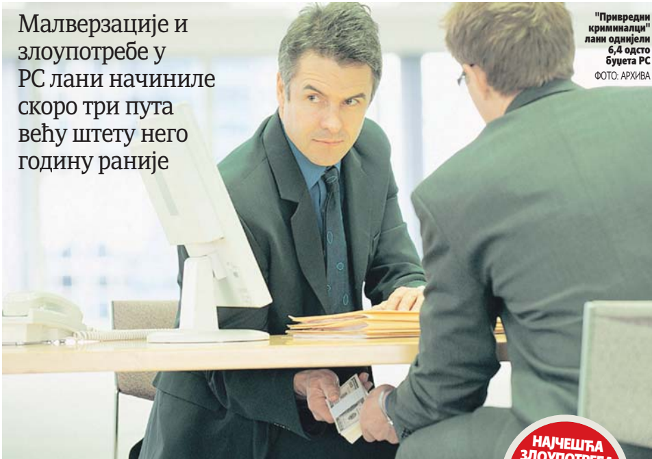
"Привредни криминалци" лани однијели 6,4 одсто буџета РС

ПИШЕ: НЕБОЈША ТОМАШЕВИЋ ntomasevic@glassrpske.com