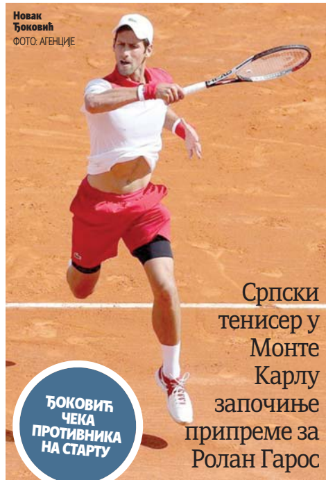
Новак Ђоковић

БЕОГРАД - Хокејаши Србије наставили су с одличним играма на Свјетском првенству Друге дивизије А група и у четвртој колу забиљежили трећу побједу савладавши Белгију са 6:3 (2:1, 2:0, 2:2). У последњем колу Србија вечерас игра против Шпаније (20 часова). Уколико побједи ривала и ако Хрвати савладају Аустралију, освојиће злато и пласираће се у виши ранг, односно Прву дивизију група Б.