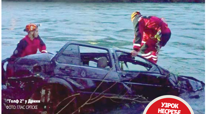
"Голф 2" у Дрини

УЗРОК НЕСРЕЋЕ ВЈЕРОВАТНО НЕПРИЛАГОЂЕНА БРЗИНА