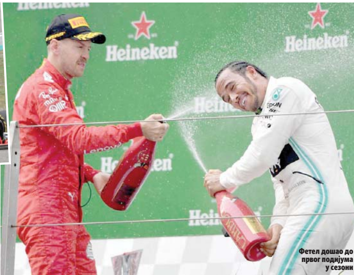
Фетел дошао до првог подијума у сезони