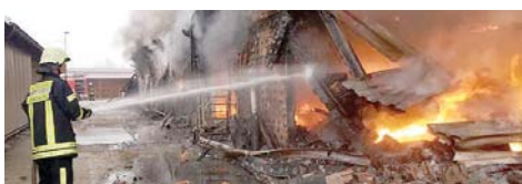
Пожар на пијаци у Градачку Ватра прогутала "Аризону", штета вишемиллионска

Полиција је обавила увиђај са дежурним тужиоцем Кантоналног тужилаштва у Тузли, као и вјештацима електро и противпожарне струке. Прије три године исту пијаци захватио је пожар у којем је изгорјело близу 500 штандова. (Агенције)