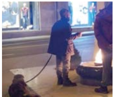
Сарајево Ухапшен због силовања пса

САРАЈЕВО - Полиција је ухапсила Г. С. (37) из Сарајева због сумње да је тукао и силовао пса у Сарајево. Потрага је услиједила након што је Удружење за заштиту животиња "Dreams" на свом "Фејсбук" профилу упозорило на особу која је у центру града сексуално злостављала пса, а том чину је свједочио један грађанин, који је случај пријавио полицији. За злостављача је речено да свакодневно шета центром града, те да је често пијан и да туче животиње. (Агенције)