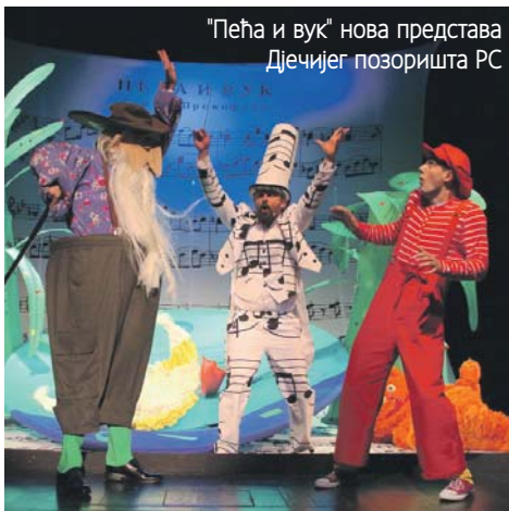
"Пеђа и вук" нова представа Дјечијег позоришта РС