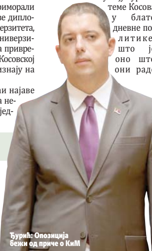
Ђурић: Опозиција бежи од приче о КиМ

- Можете видети да они користе и исти речник врло често - истакао је директор Владине канцеларије за КиМ. (Агенције)