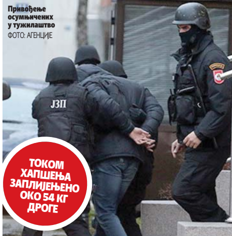
Привођење осумњичених у тужилаштво

ТОКОМ ХАПШЕЊА ЗАПЛИЈЕЊЕНО ОКО 54 КГ ДРОГЕ