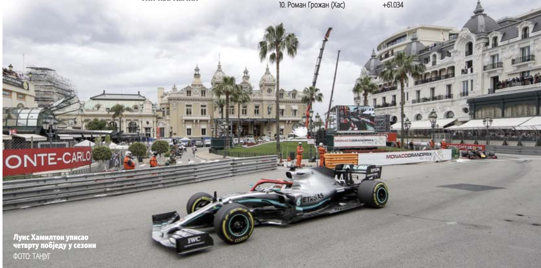
Луис Хамилтон уписао четврту побједу у сезони

МОНТЕ КАРЛО - Актуелни шампион "формуле 1" Луис Хамилтон уписао је четврту побједу у сезони, јер је успио да сачува предност на Великој награди Мо-