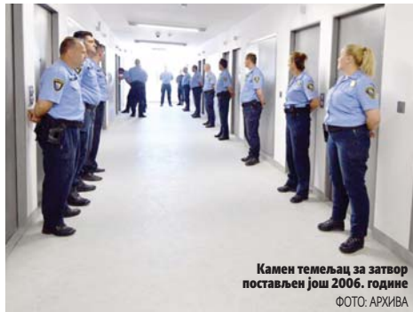
Камен темељац за затвор постављен још 2006. године

ближе ставове и откоче процес формирања но-