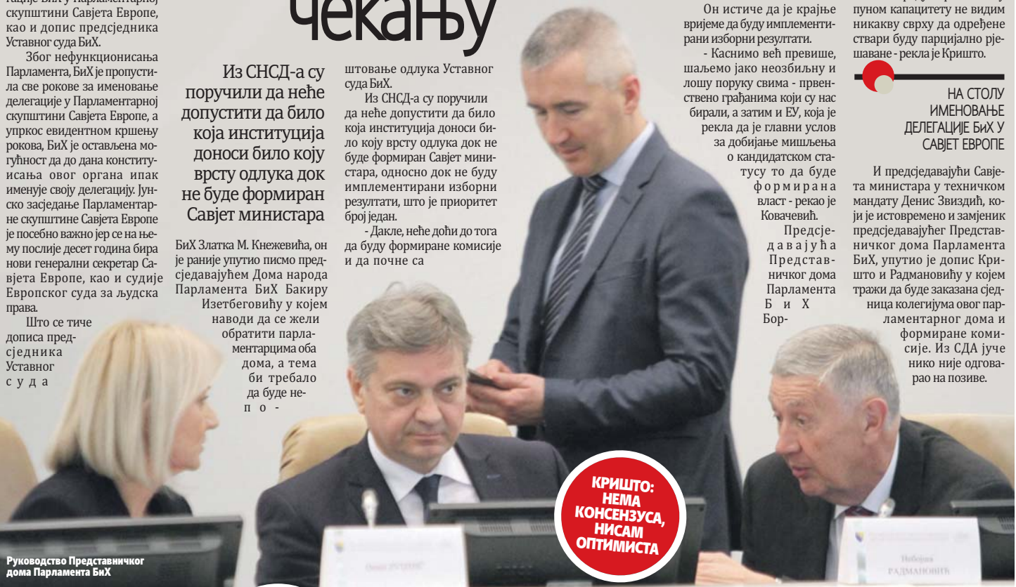
Руководство Представничког дома Парламента БиХ