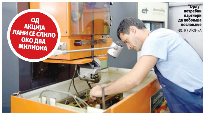
"Орлу" потребни партнери да побољша пословање