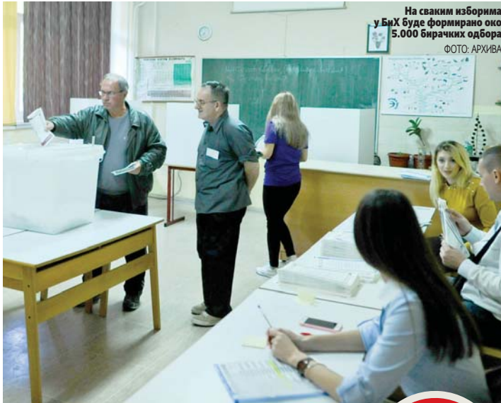
На сваки изборима у БиХ буде формирано око 5.000 бирачких одбора