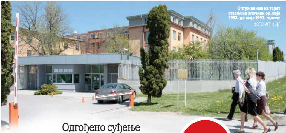
Оптуженима на терет стављени злочини од маја 1992. до маја 1993. године