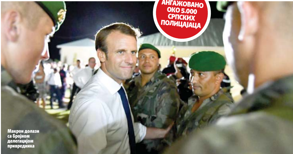
Макрон долази са бројном делегацијом привредника

БИЋЕ АНГАЖОВАНО ОКО 5.000 СРПСКИХ ПОЛИЦИЈАЦА