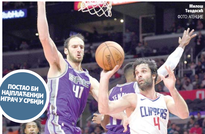
Милош Теодосић

НА ПОМОЛУ РЈЕШЕЊЕ САГЕ У ВЕЗИ СА НОВИМ КЛУБОМ МИЛОША ТЕОДОСИЋА