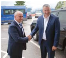
Источни Стари Град Стиже подршка пројектима