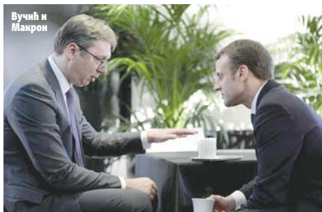
Вучић и Макрон

Макрон наводно у Београд долази са око 100 француских припадника безбједности, наводе српски