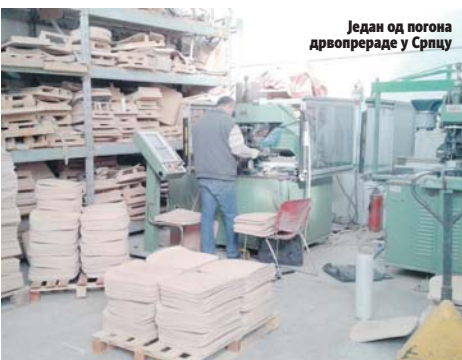
Један од погона дрвопрераде у Српцу

- Један дио средстава биће издвојен и за запошљавање ових категорија код послодавца, а обезбиједили смо и финансијску подршку за samozапшљавање лица старости до 40 година за покретање предузетничке дјелатности - рекао је на-