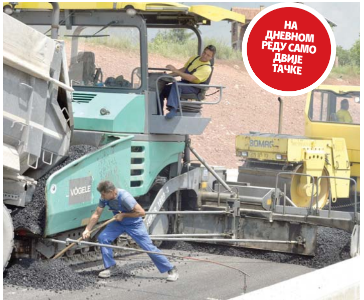
НА ДНЕВНОМ РЕДУ САМО ДВИЈЕ ТАЧКЕ

- Друга тачка дневног реда је приједлог одлуке о износу гаранција које Српска може издати у овој години. Ријеч је о оквирном износу који се усваја за 2019. годину - рекао је Вишковић и објаснио да су гаранције Владе потребне за наставак реализације великих инфра-