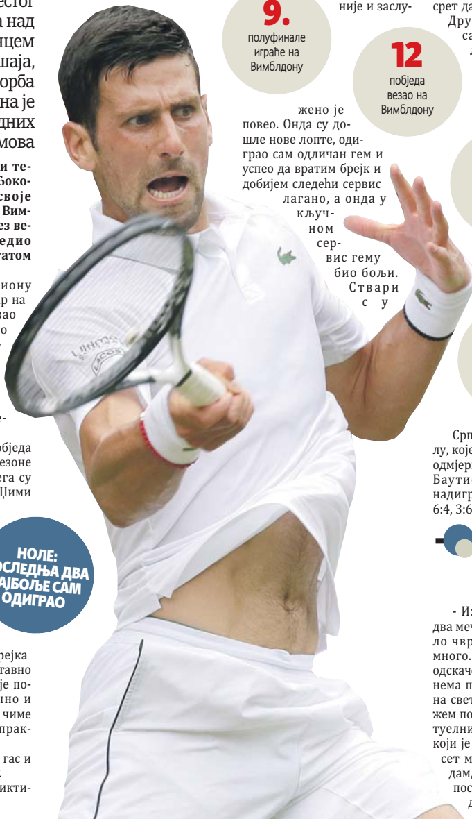
Новак Ђоковић

Тада је мало смањено гас и лагано привео меч крају. - Он је боље почео, дикти-