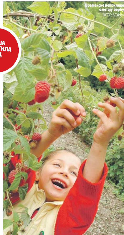
Временске неприлике ометају бербу