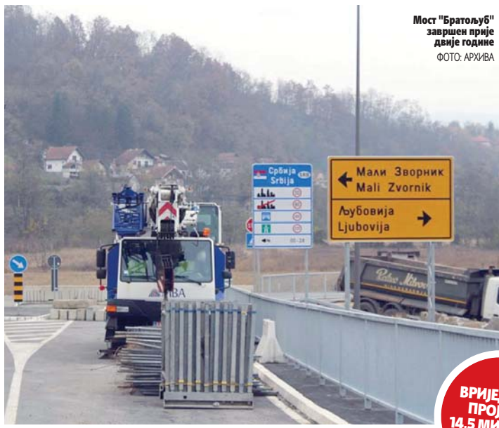
Мост "Братољуб" завршен прије двије године

Прича о граничном прелазу код "Братољуба" траје мјесецима, а у Управи за индиректно опорезивање (УИО) БиХ рекли су раније да имају обезбијеђених 11 милиона КМ за пројекат, од чега је већи дио из средстава клириншког дуга. Чланови УО УИО су, затим, крајем прошле године дали сагласност да, уз предвиђених 11 милиона, буде одобрено додатних 3,5 милиона из буџета институција БиХ, али проблеми нису још ријешени.