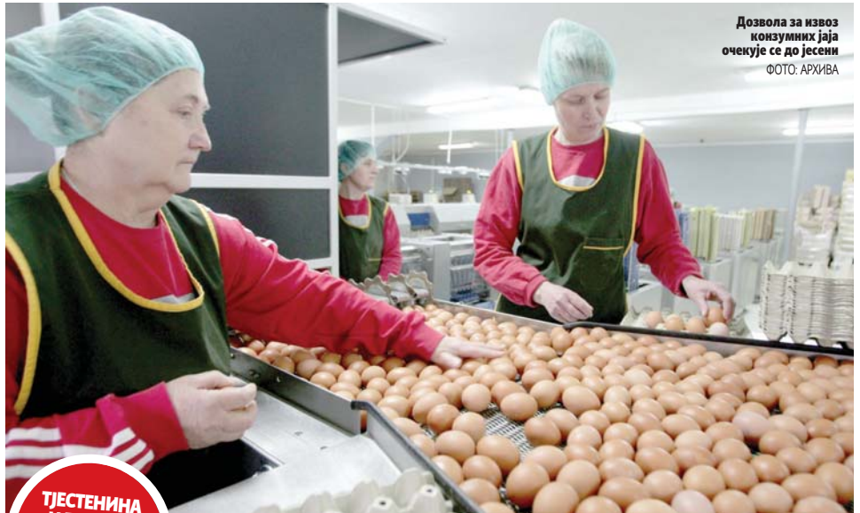
Дозвола за извоз конзумних јаја очекује се до јесени

ТЈЕСТЕНИНА И ПЕЦИВА СА ЈАЈИМА МОГУ НА ТРПЕЗУ У ЕУ