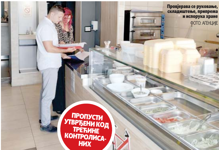
Пројекција се руковање, складиштење, припрема и испорука хране

ПРОПУСТИ УТВРЂЕНИ КОД ТРЕЋИНЕ КОНТРОЛИСАНИХ