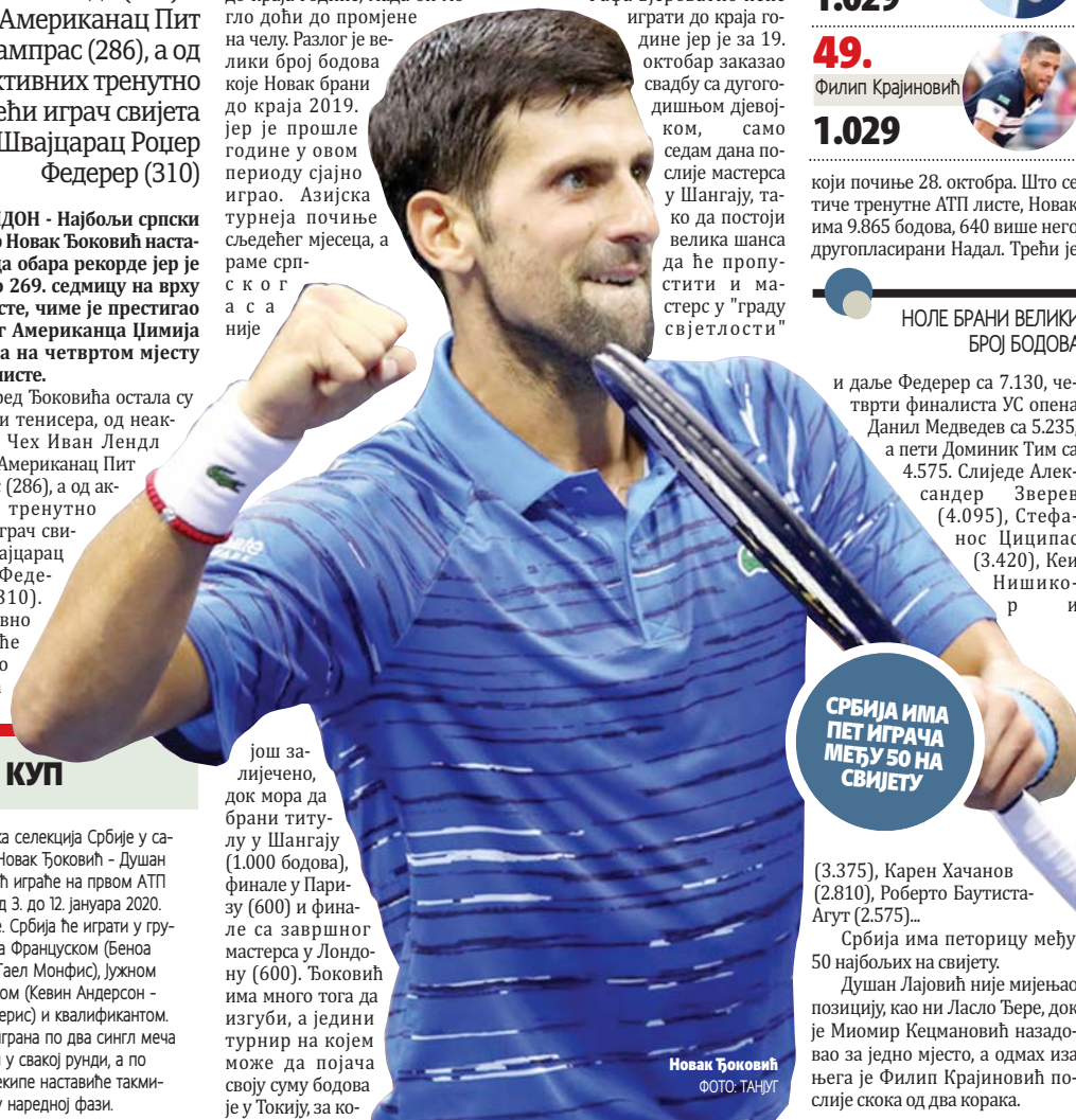
Новак Ђоковић

ји може добити 500 бодова и који почиње 30. септембра, а већ је потврдио наступ на њему, што ће му бити припрема за Олимпијске игре наредног лjeta. Оно што Нолета може да радује је да Рафа вјероватно неће играти до краја године јер је за 19. октобар заказао свадбу са дугогодишњом дјевојком, само седам дана послије мастера у Шангају, тако да постоји велика шанса да ће пропусти и мастерс у "граду свјетлости"