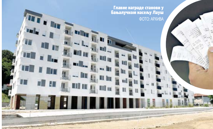
Главне награде станови у Бања Луком насељу Лауш

40.000 коверата дневно - рекао је Дурић.