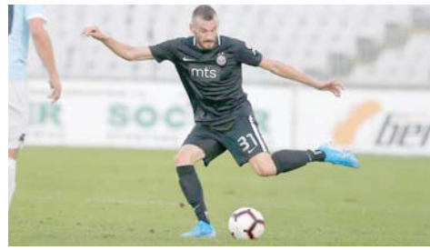
као је Брежанчић. Проблем за "црно-бијеле" је казна УЕФА због које ће на трибине баш као и

шимо, нису они неки баук, нити су нешто посебно, по мени, била је много боља екипа када сам ја био тамо, али морамо да их схватимо озбиљно ако желимо да победимо - ре-