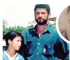
ЛОНДОН - Један од најбољих фудбалера свијета Кри-

стијано Роналдо расплакао се током интервјуа који је дао новинару Пирсу Моргану за британску телевизију "ИТВ" када му је овај приказао снимак оца, који је о њему причао пред Европско првенство 2004. године. - Нисам никад видео тај