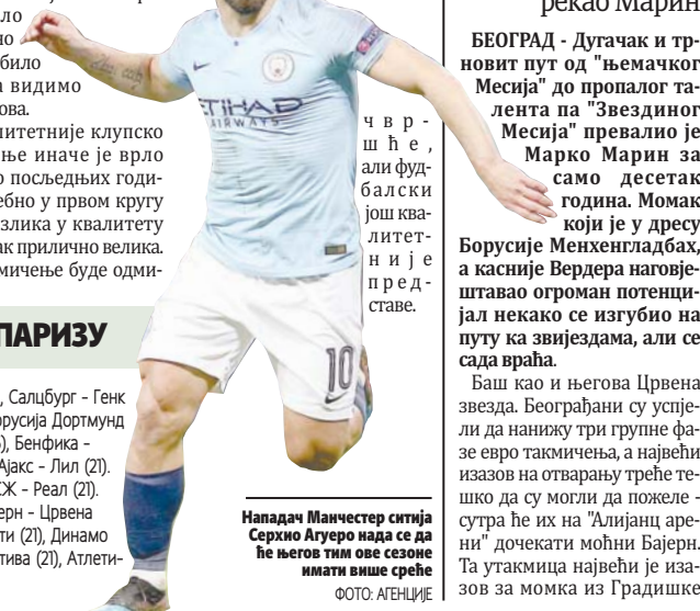
Нападач Манчестер ситија Серхио Агуеро на да се да ће његов тим ове сезоне имати више среће

цало и приближавало се велико финале које је заказано за 30. мај 2020. године на стадиону "Ататурк" у Истанбулу могу се очекивати