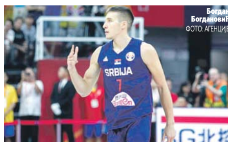
Богдан Богдановић