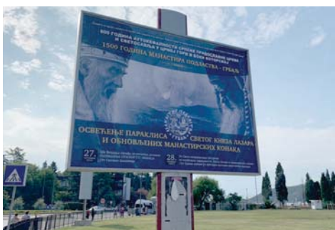
За Црногорски покрет спорни билборди у Будви

- Отпјевајмо ону прекрасну попевку " бум дома, сел си бум под брајде", коју смо пјевали с војницима у Авганистану, јер је настала у оним временима када се није смјела помињати Хрватска, Хрватско загорје, домовина, све оно што је изражавало домољубље - рекла је председница. (Агенције)