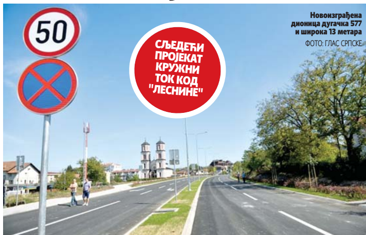
Новоизграђена дионица дугачка 577 и широка 13 метара

- Надамо се да ће изградње те кружне раскрснице ускоро почети и тиме ћемо овај правац спојити са кру-