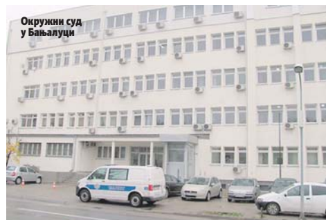
Окружни суд у Бањалуци