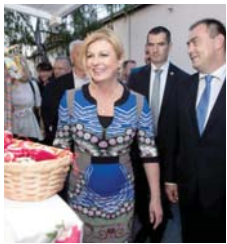
Загреб Председница побркала године

ЗАГРЕБ - Хрватска председница Колинда Грабар-Китаровић учинила је гаф током 54. Фестивала кајавских попевки у Крапини када је за песму која је настала 2000. године "Под брајде", изјавила да је настала у временима "када се није смјела помињати Хрватска, домовина, домољубље..."