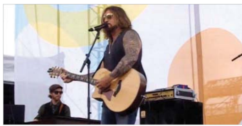
Драма из 2014. године. Ово је прича о Џејку Рисону, звијезди кантрија у успону, којем је цијели свијет био под ногома, све док га његово его није упропастио. Остали су му само партијање и музика. Улоге: Били Реј Сајрус, Цоел Смалбоун, Џенифер Тејлор Режија: Џони Ремо