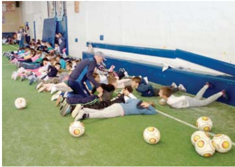
Пети дјечији фудбалски фестивал "Спартанац 2019"