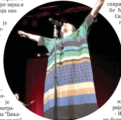
"Рођени", "Црно и бело", "Невиност", "Кофер љуба-

КАЛИОПИ: СВАКИ КОНЦЕРТ ДРУГАЧИЈИ, ТО ЈЕ ДО ПУБЛИКЕ