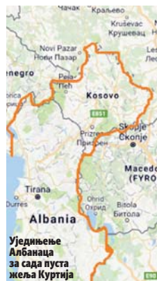
Уједињење Албанаца за сада пушта жеља Куртија