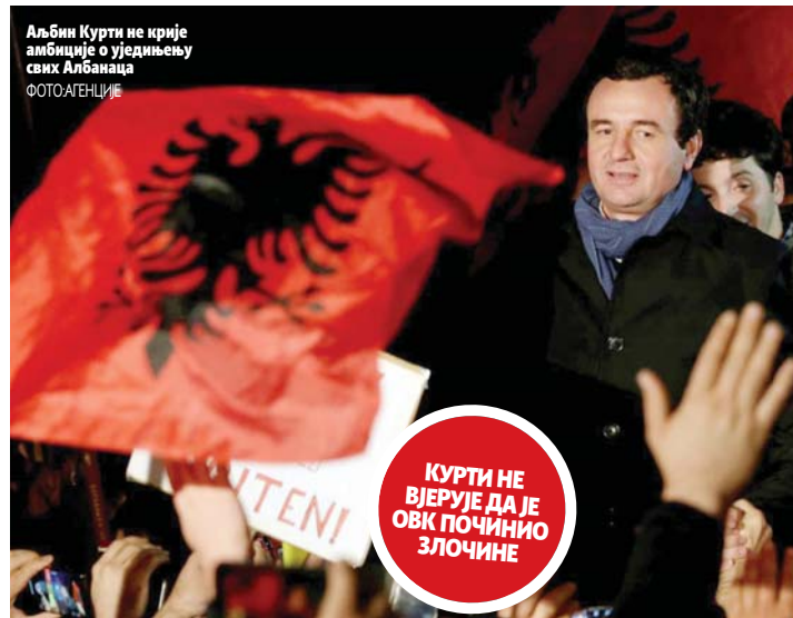
Албин Курти не крије амбиције о уједињењу свих Албанаца