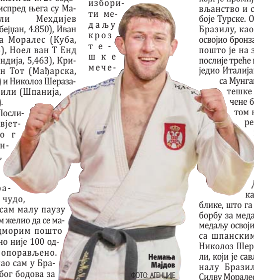
Немања Мајдов

Олимпијске игре и циљ ми је да останем у норми. Био сам мало психички уморан, са ситним повредама и нисам био у пуном интензитету тренинга и максималној форми, али сам направио одличне мечеве и дошао до велике медаље и још већих 500 бодова. Задовољан сам, али не и презадовољан јер нисам стигао до злата, мада је у овим околностима било тешко изборити ме даљу кроз тешке мечеве.