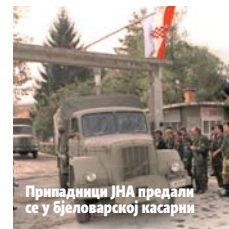
Припадници ЈНА предали се у бјеловарској касарни

Три припадника ЈНА су прозвани и изведени из строја, а након тога су се чули пуцњи. Њихова тијела се виде и на снимцима које су направили Хрвати, казао Штрбац