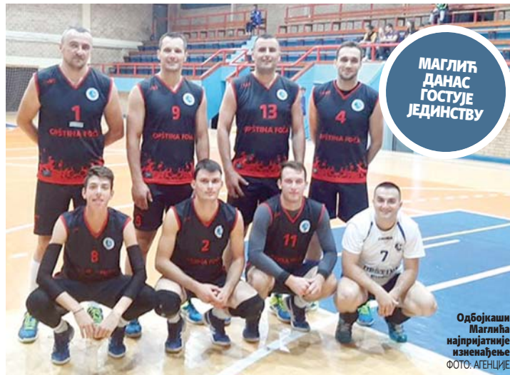
МАГЛИЋ ДАНАС ГОСТУЈЕ ЈЕДИНИЦУ

Одбојкаши Маглића најпријатније изненађење