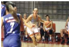
WABA лига, шесто коло