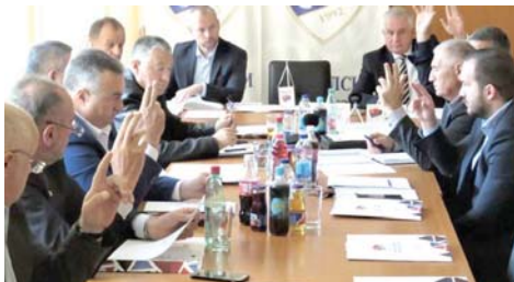
Конечно одржана сједница Извршног одбора Фудбалског савеза РС

СТАРА ЗАГОРА - Кошаркашице Орлова вечерас од 18 часова гостоваће код Бероа у шестом колу WABA лиге. Бањалучанке су једини тим који нема побједу у досадашњем дијелу регионалног такмичења док Бугарке уз Цеље имају максималан учинак те држе прва два мјеста на табели. Уједно, домаћин овог сусрета актуелни је шампион WABA лиге.