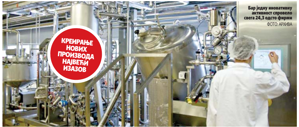
Бар једну иновативну активност спровело свега 24,3 одсто фирми

Улагање у производну линију, иновативне производе и освајање нових тржишта услов опстанка предузећа, нагласио Ђорић