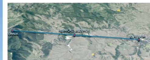
Златибор добија нови мамац за туристе

До краја године бити завршено развлачење сајле, а први путници ће се најдужом