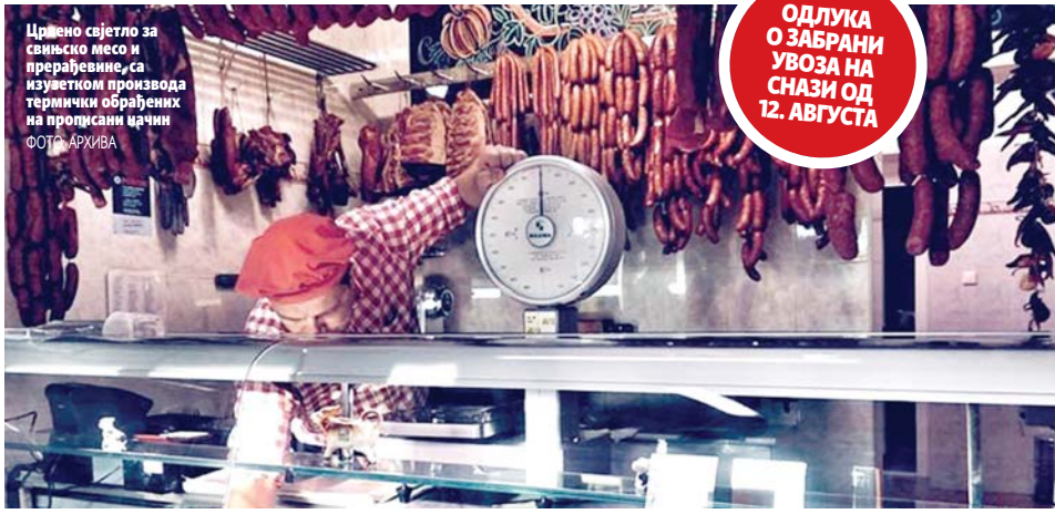
Црвено свјетло за свињско месо и прерађевине, са изузетком производа термички обрађених на прописани начин

Када се утврди да болести нема на одређеном простору и локацији, та земља подноси извјештај Европској комисији, која им потом