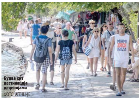
Будва хит дестинација деценијама

У студији коју су израдили конзорцијум загребачких компанија Хотелско и дестинацијско саветовање,