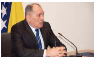
ОБРАД КЕСИЋ, ШЕФ ПРЕДСТАВНИ- ШТВА РС У ВАШИНГТОНУ