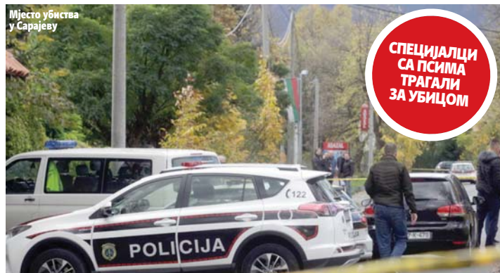
Мјесто убиства у Сарајеву