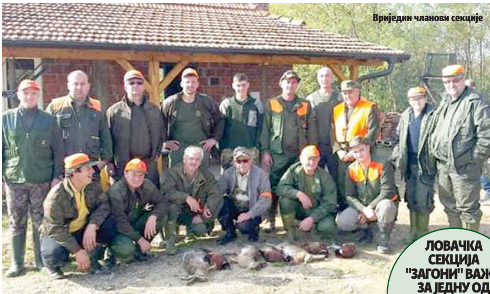
Вриједни чланови секције