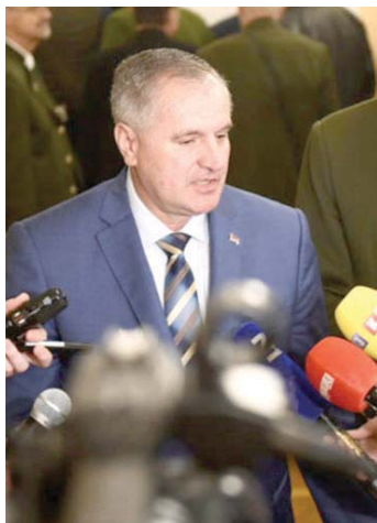
Предсједник Владе Радован Вишковић редован гост на свечаностима Ловачког савеза