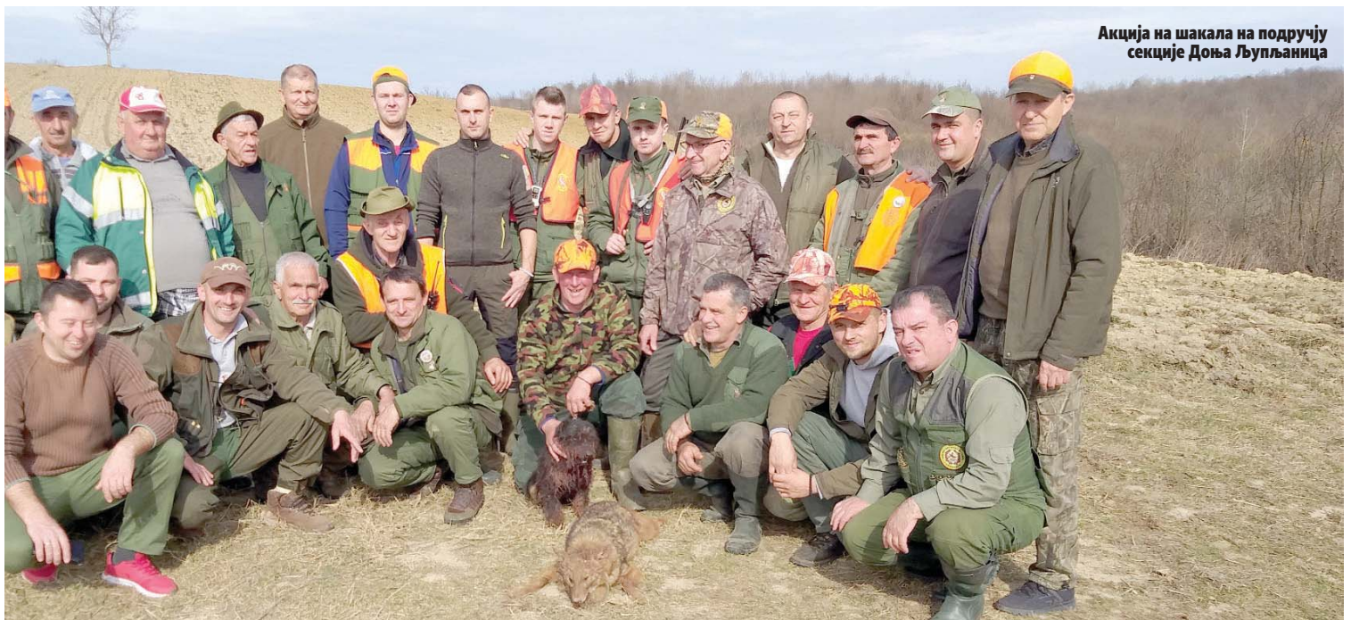
Акција на шакала на подручју секције Доња Љупљаница

Колики је ниво садашње бројности шакала у ловишту "Мотајица" Дервента показују и резултати анкете међу дервентским ловцима, који показују да је у току ловне 2019/2020. године одстријељено 118 шакала, док их је шест настрадало на саобраћајницама. Да је распрострањеност на појединим подручјима ловишта веома велика можемо закључити из чињенице да је само на "Дервентској шакалијади", одржаној у Босанским Лужанима крајем фебруара 2020. године, одстријељено десет шакала.