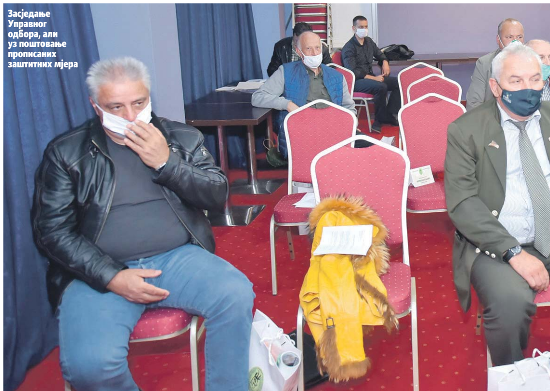
Засједање Управног одбора, али уз поштовање прописаних заштитних мјера

Засједао Управни одбор Ловачког савеза РС