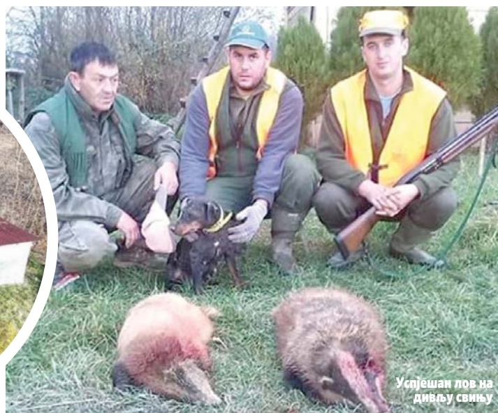
Успјешан лов на дивљу свињу