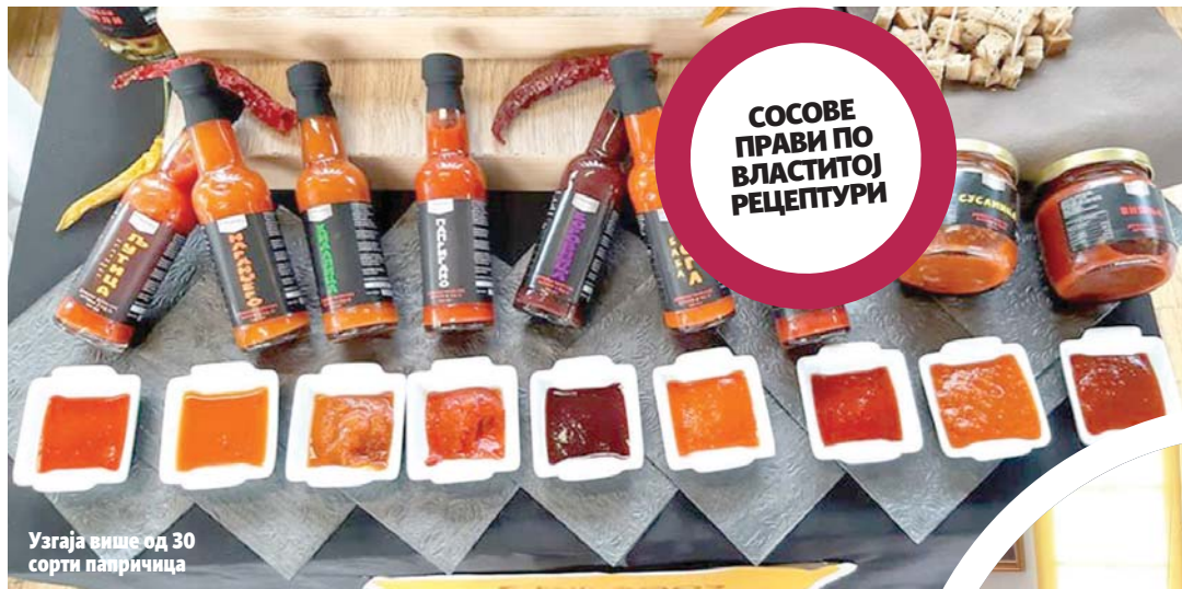
Узгаја више од 30 сорти папричица