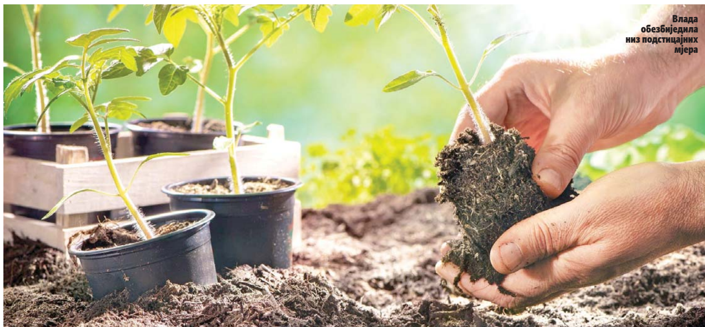
Влада обезбједила низ подстицајних мјера

Такође, у условима ванредне ситуације изазване пандемијом вируса корона, очекује се и раст потражње прерађивачке индустрије за домаћом сировином, што би могло повољно утицати на раст обима производње у сточарству и изнад процијењених вриједности из прошле године.