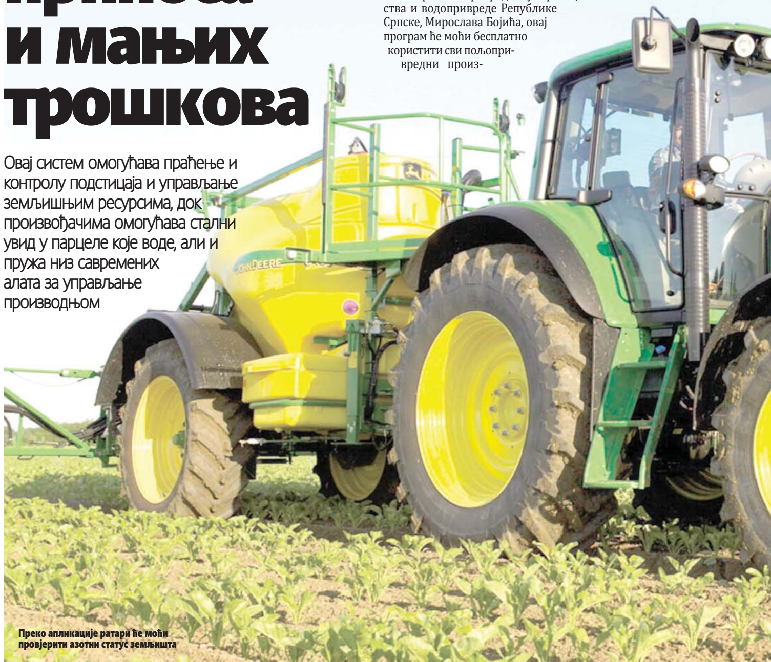
Преко апликације ратари ће моћи проверити азотни статус земљишта