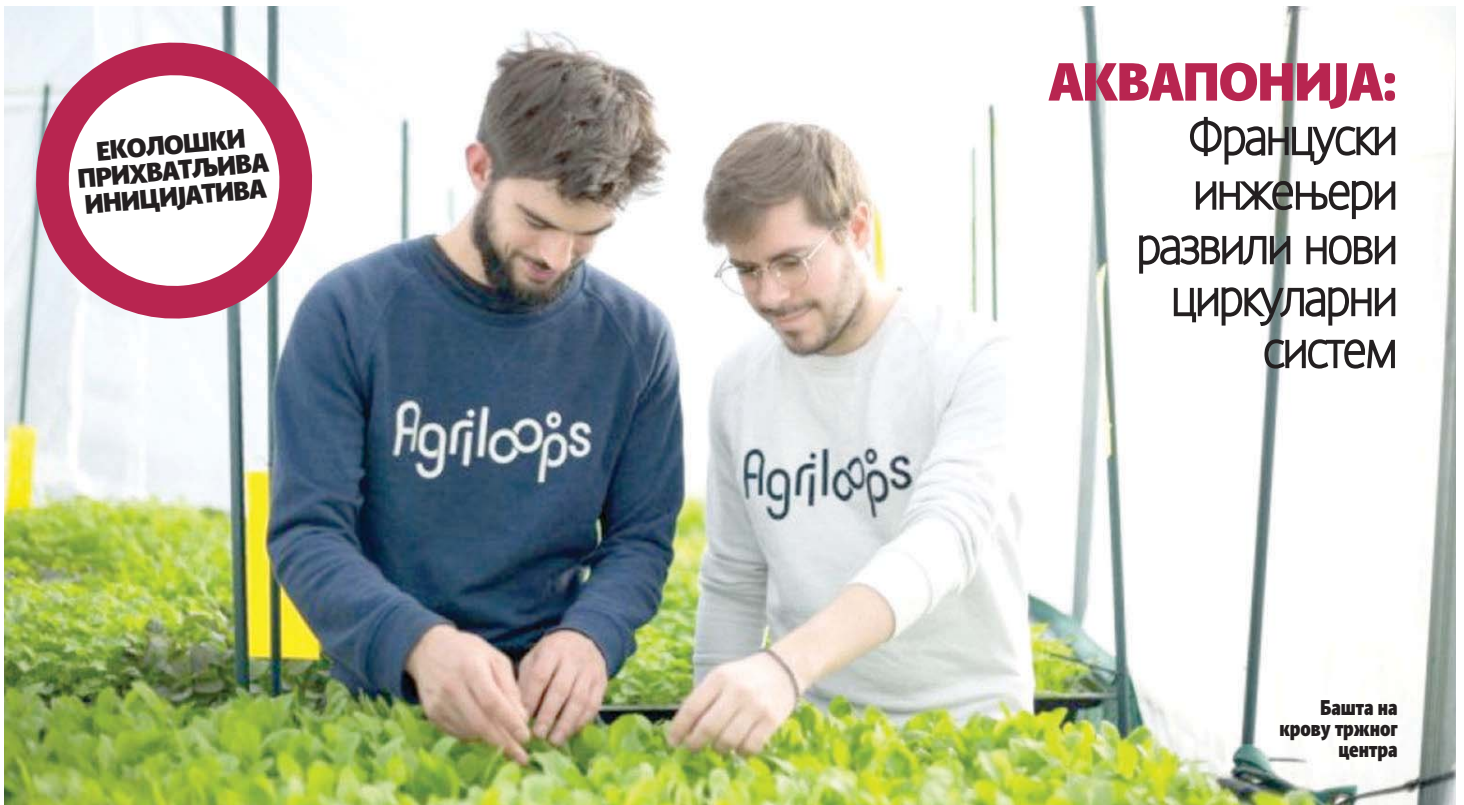
Башта на крову тржног центра

АКВАПОНИЈА: Француски инжењери развили нови циркуларни систем