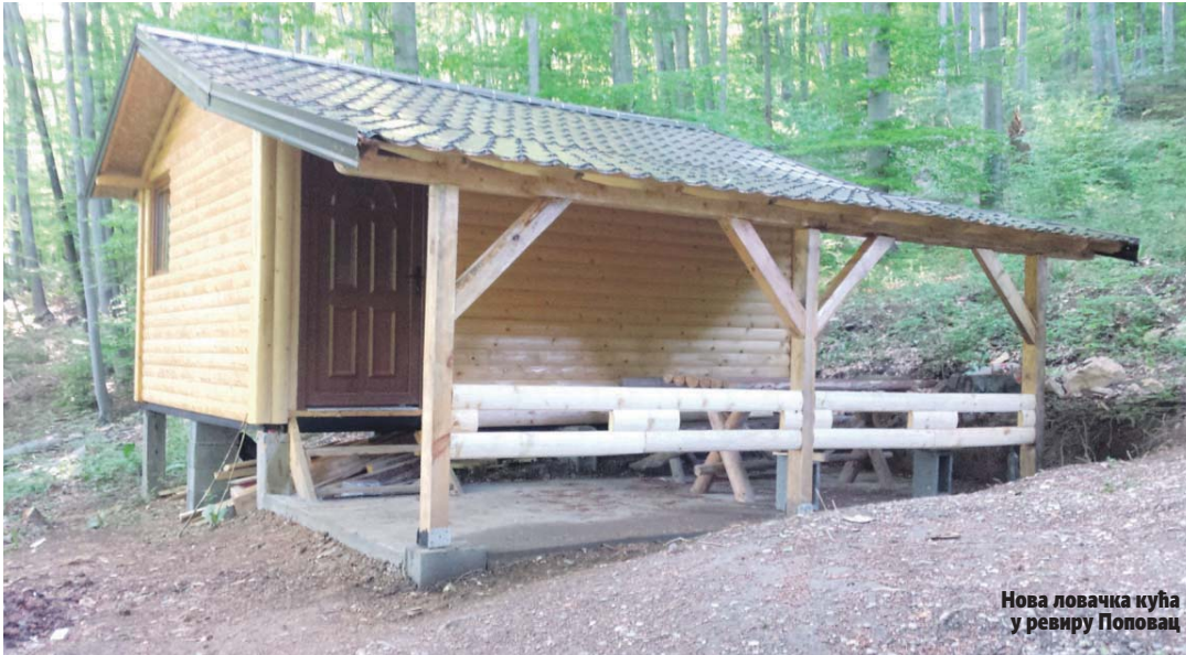
Нова ловачка кућа у ревиру Поповац