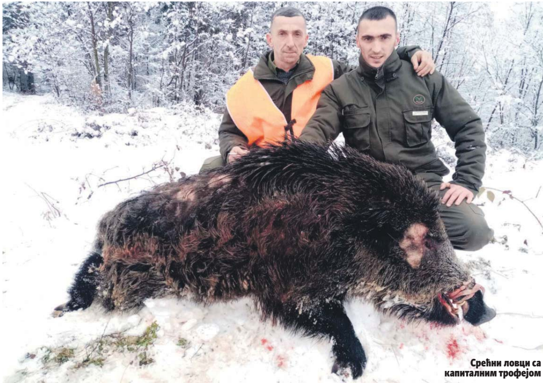
Срећни ловци са капиталним трофејом