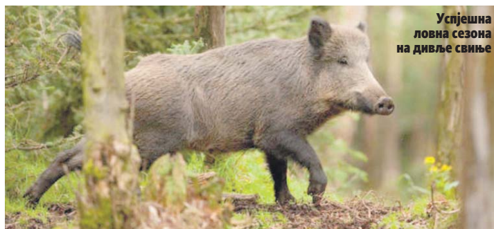
Успјешна ловна сезона на дивље свиње

Ловачко удружење "Игришта" основано је 2010. године, а тренутно у пет секција окупља 218 чланова, од којих су њих 150 матични ловци.