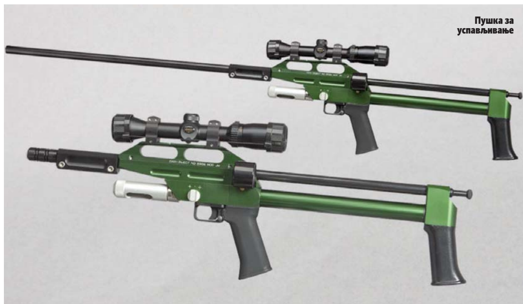
Пушка за успављивање