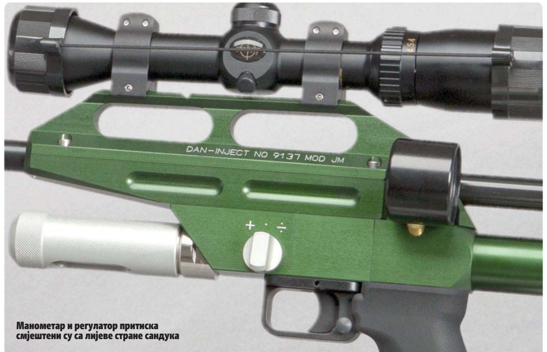
Манометар и регулатор притиска смјештени су са лијеве стране сандука

Инјекторске стрелице су конструкционо ријешене за виšekратну употребу - поновно пуњење, растављање, чишћење и одржавање (само су силиконски прстенови игала једнократни). Ху-