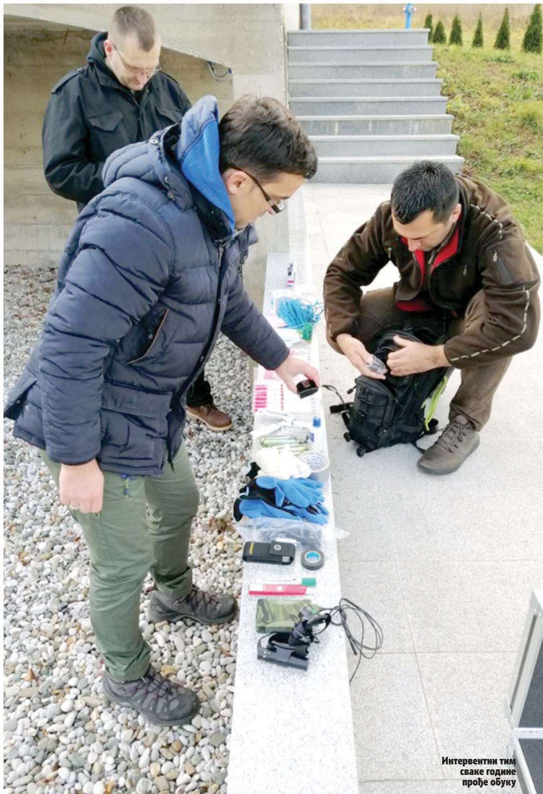
Интервентни тим сваке године прође обуку