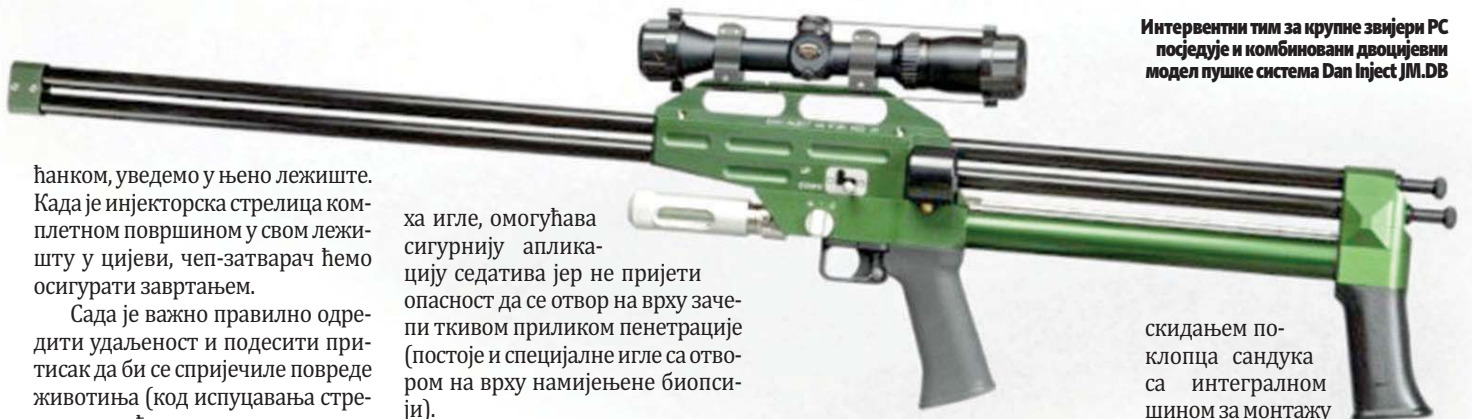
Интервентни тим за крупне звијери РС посједује и комбиновани двоцијевни модел пушке система Dan Inject JM.DB

ћанком, уведемо у њено лежиште. Када је инјекторска стрелица комплетном површином у свом лежишту у цијеви, чеп-затварач ћемо осигурати завртањем.