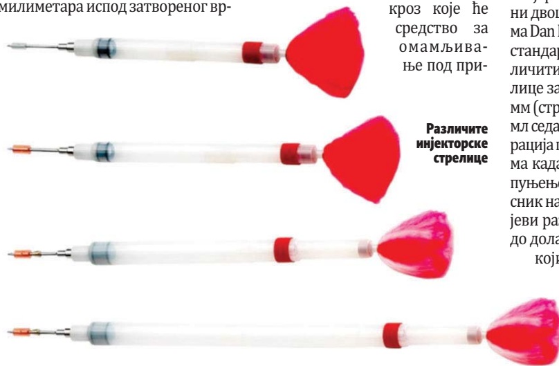
Различите инјекторске стрелице

У тренутку када "Мердокова" инјекторска стрелица погоди циљ односно пробије кожу животиње, долази до помјерања заштитног еластичног силиконског прстена на игли који клиже уназад, ослобађајући отворе кроз које ће средство за омамљивање под при-