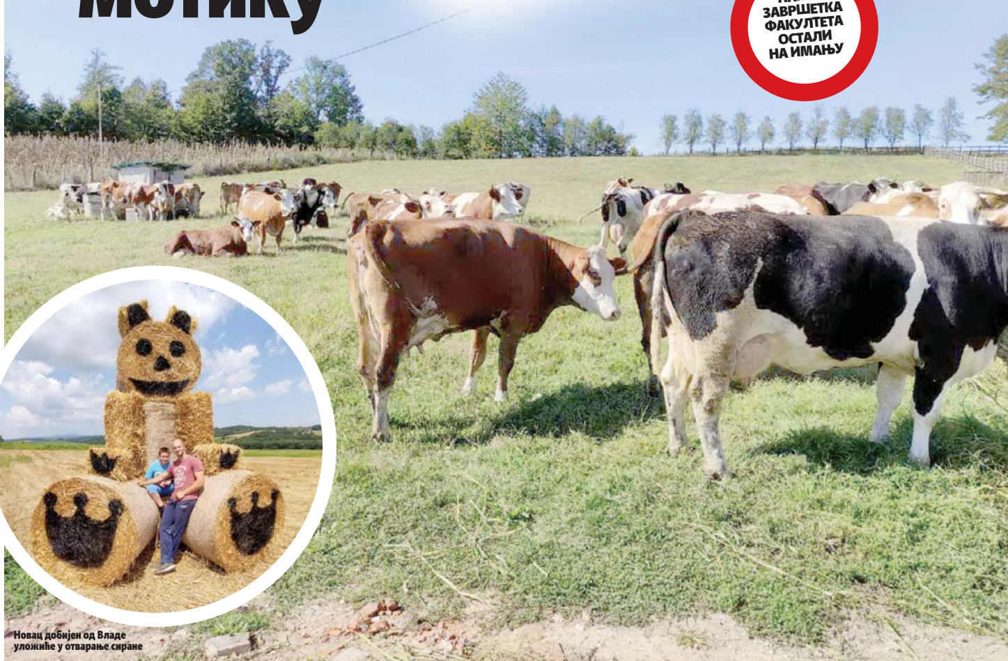
Новац добијен од Владе уложиће у отварање сиране

НАКОН ЗАВРШЕТКА ФАКУЛТЕТА ОСТАЛИ НА ИМАЊУ