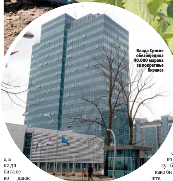
Влада Српске обезбједила 40.000 марака за покретање бизниса

да када би га неко данас упитао да ли би се могао пронаћи и вдијети у неком другом послу, рекао би да не би.