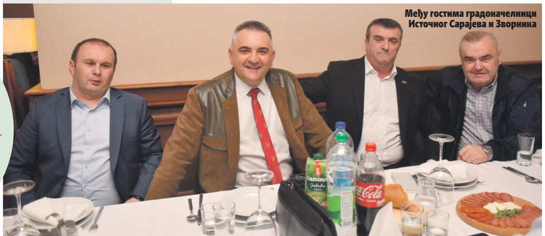
Међу гостима градоначелници Источног Сарајева и Зворника

Одавно у Власеници, кажу присутни, није било веселијег догађаја од ове ловачке забаве. Љепота ловачког дружења осјећала се за сваким столом. Људовање ловаца и њихових пријатеља трајало је до дубоко у ноћ.