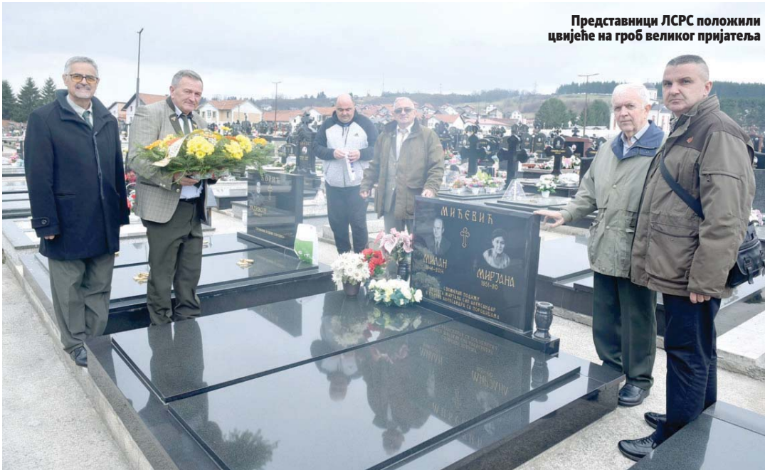
Представници ЛСРС положили цвијеће на гроб великог пријатеља

Зато се, нагласио је Драшковић, такав човек једноставно не може заборавити и ловци ће га се с посебним пијететом увијек сјећаати.