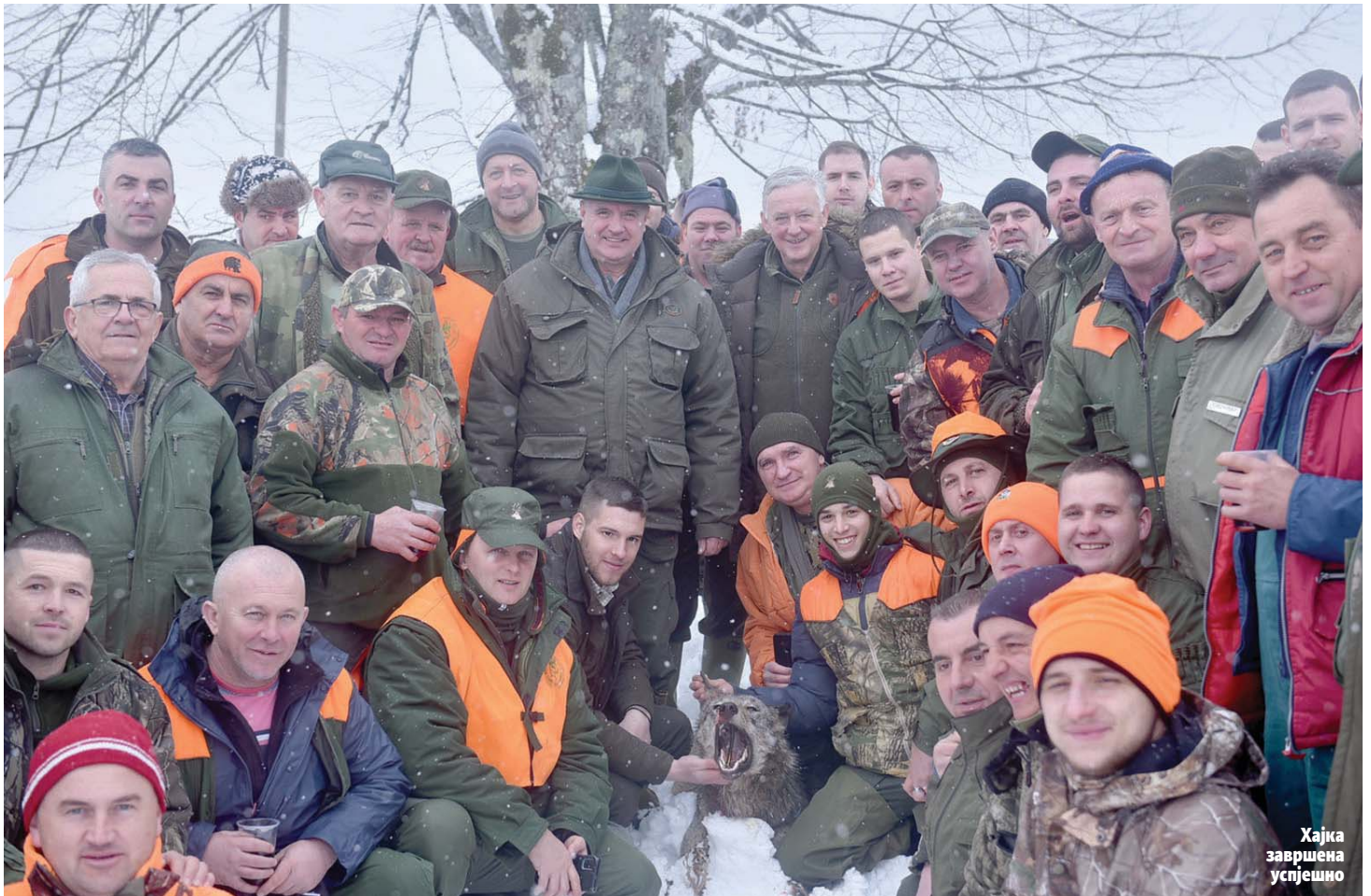
Хајка завршена успјешно