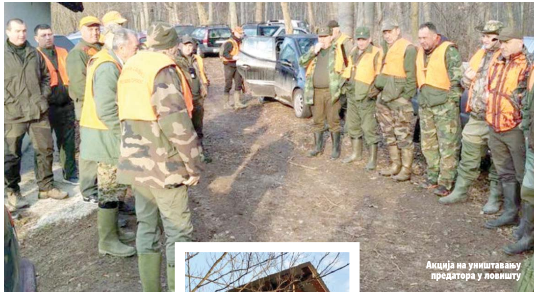
Акција на уништавању предатора у ловишту

- Изградили смо пет високих чека за лов сrneће дивљачи. Само у посљедњих годину дана направили смо три, за чију градњу смо материјал обезбиједили уз помоћ наших ловаца и матич-