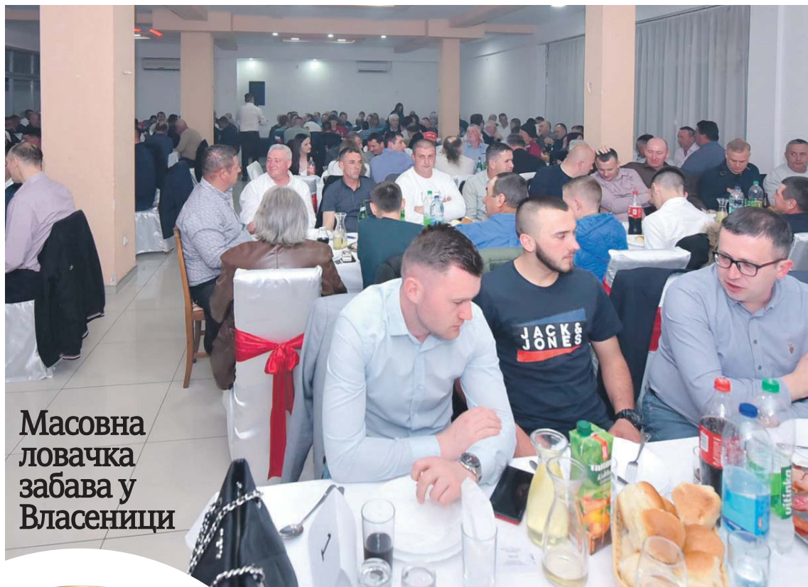
Масовна ловачка забава у Власеници

- Иза нас је успјешна година проткана бројним активностима наших ловаца. У протеклом пе-