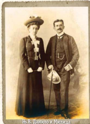
Њ.В. Данило и Милица