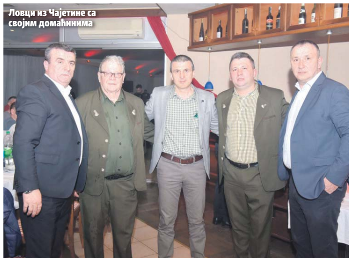
Ловци из Чајетине са својим домаћинима