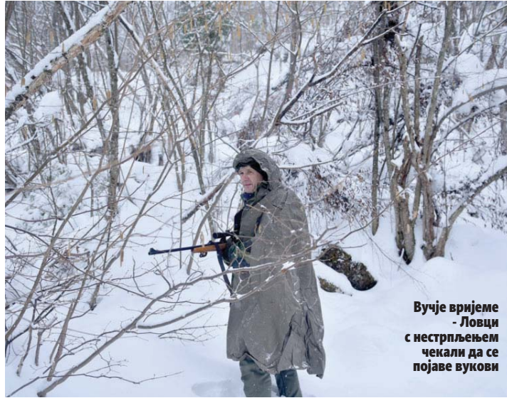
Вучје вријеме - Ловци с нестрпљењем чекали да се појаве вукови

Терен на којем се одвија хајка, слушамо од наших домаћина, биће скроз "прегажен" и претресен