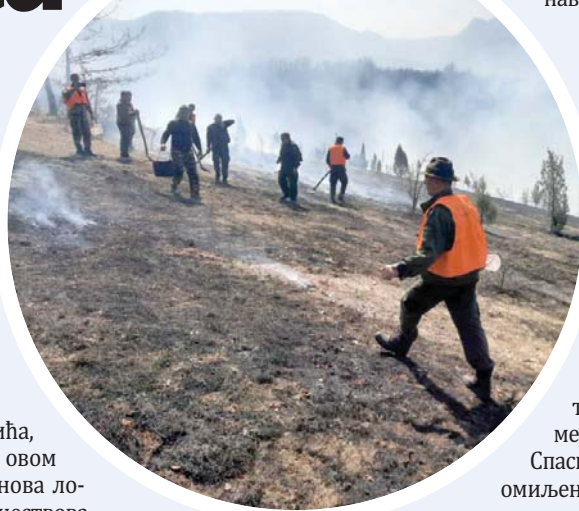
Ловци у гашењу ватрене стихије