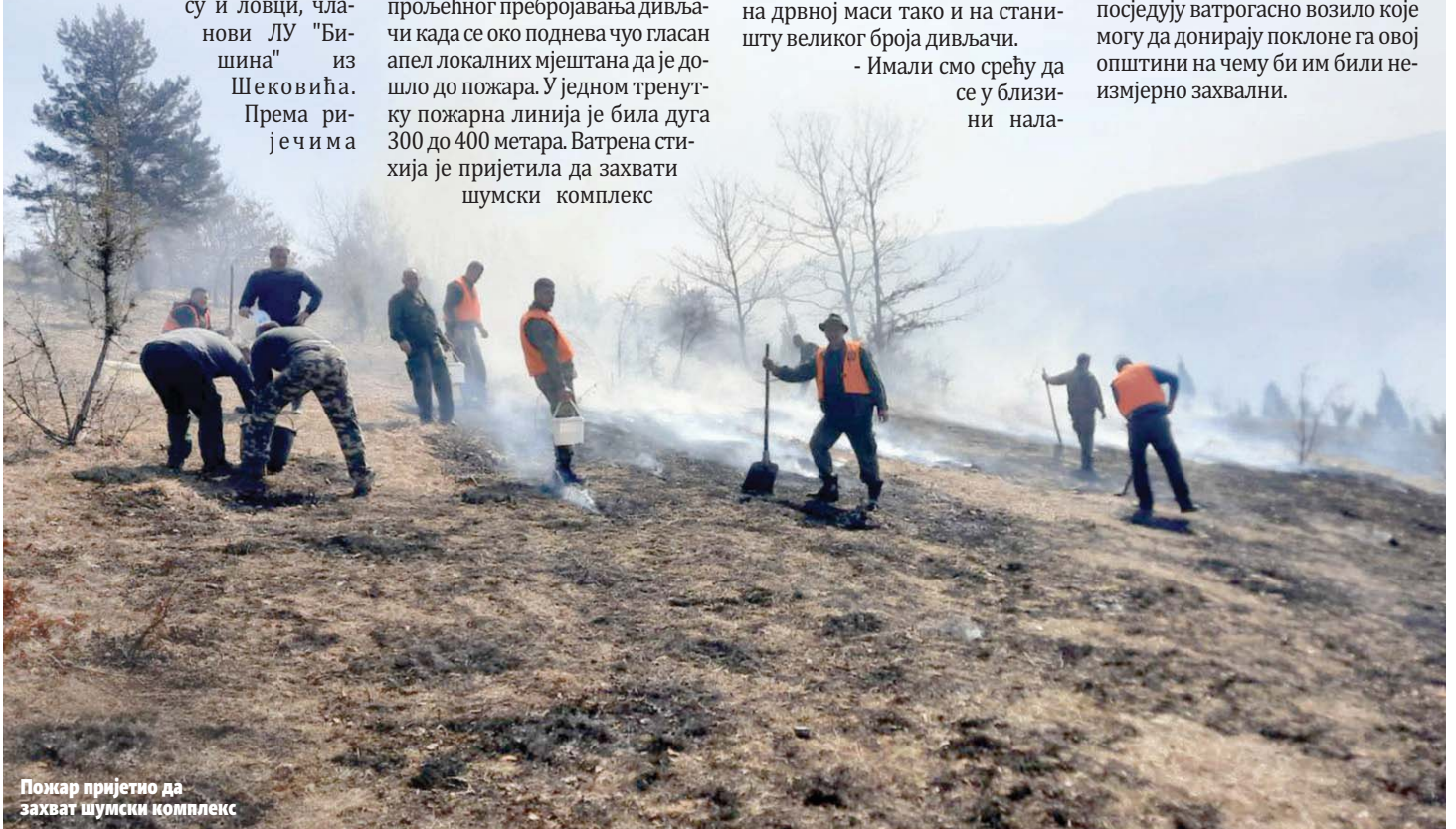
Пожар пријетио да захвати шумски комплекс