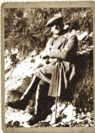
Краљ у ловишту Дива Грабовица - јесен 1932.

„Ловачко рибарски вјесник“ бр. 10 за 1934. год.