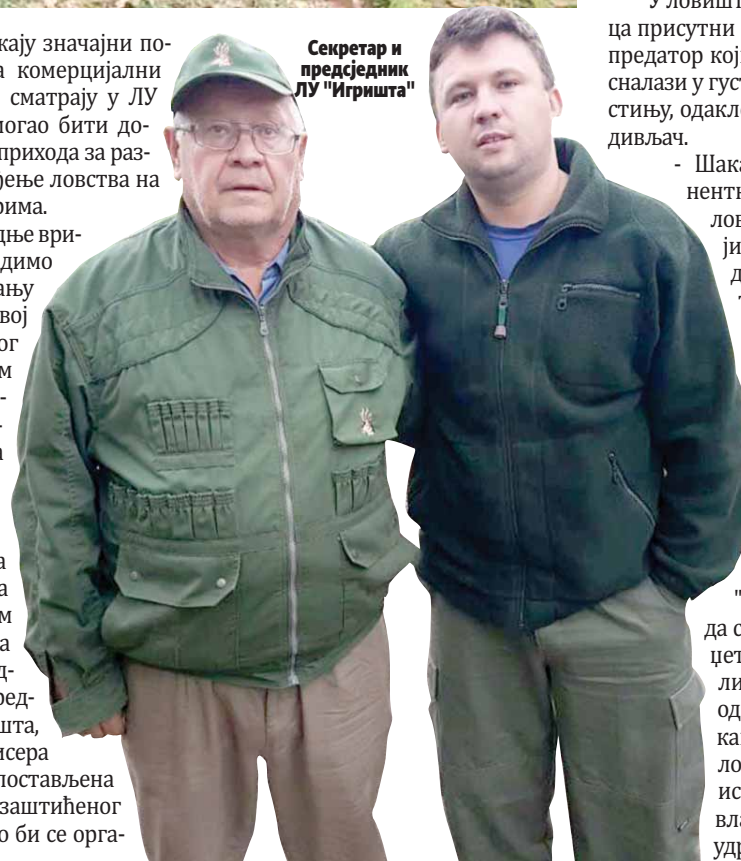
Секретар и председник ЛУ "Игришта"