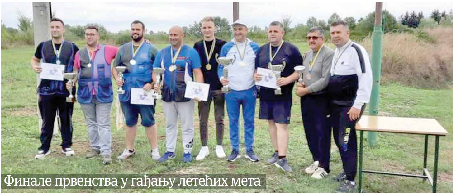
Финале првенства у гађању летећих мета

Д омаћин великог финала првенства БиХ у гађању летећих мета у дисциплини трап био је Стрелачки клуб "Таргет" из Брчког, а екипа Стрелачког клуба "Семберија" освојила је прво мјесто и оборила државни рекорд са 324 погођене мете.