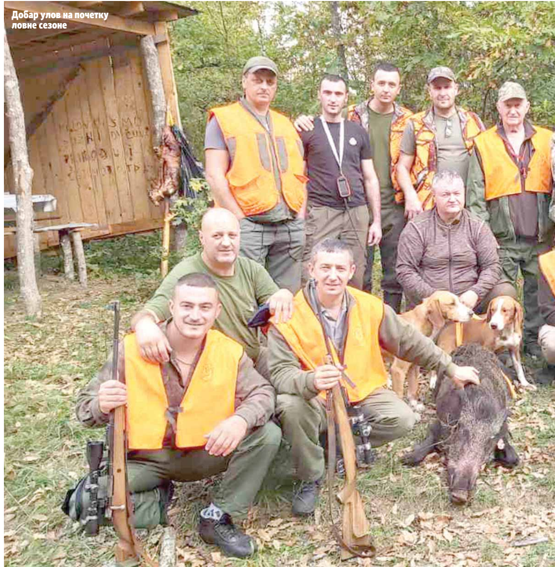
Добар улов на почетку ловне сезоне

Узгој и заштита дивљачи су међу примарним задацима власеничких ловаца. Редовно се одвијају акције на прихрани дивљачи и изношењу хране у ловиште, што је, како кажу у ЛУ "Игришта", утицало на раст фонда дивљачи, посебно дивље свиње, као и задовољавајући број срнеће популације. - Сваке године, посебно у зимском периоду, изнесемо око пет тона кукуруза и двије до три тоне кланичног отпада на мрциниште како би дивљач могла да преживи у периоду ниских температура и хладног времена - истиче Голић, додајући да су овдашњи ловци засијали и два дунума јечмом и дивљим кромпиром - чичоком ради што успјешније прихране дивљачи и смањења штета на пољопривредним посједима.